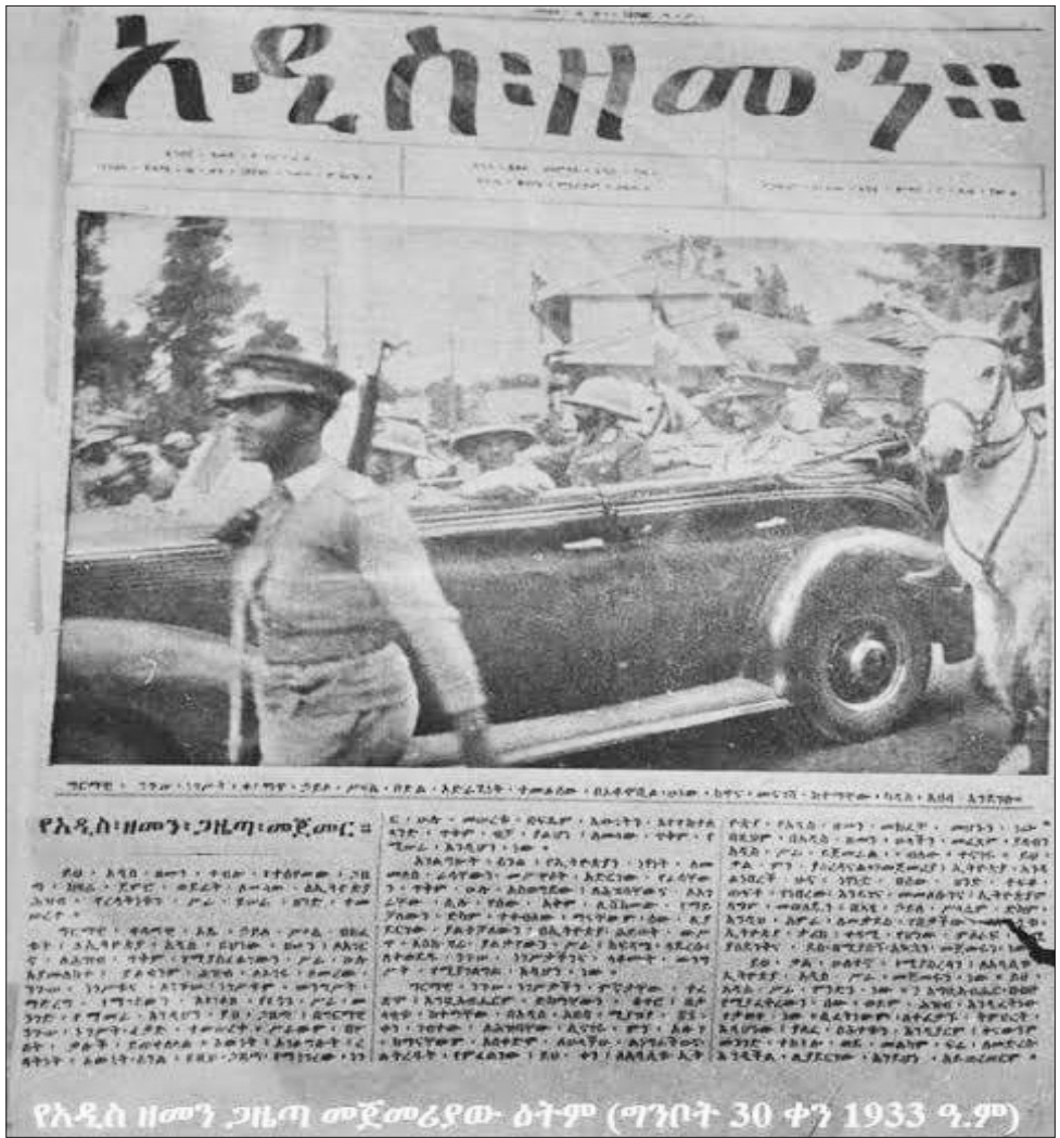
የአዲስ ዘመን ጋዜጣ የመጀመሪያው ዕትም ግንቦት 30 ቀን 1933 ዓ.ም

አሁን ላይ ያለ ወጣት ንጉሣዊ ሥርዓቱ ምን አይነት እንደነበር አያውቅም። ቤተ መጻሕፍት በመግባት ግን