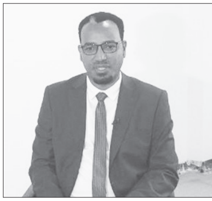
ሸካ አንተነህ ፍቃዱ

የሀገርን ኢኮኖሚ ለማሳደግ፣ የምርት ጥራትን ለማረጋገጥና ምርትና ምርታማነትን ለመጨመር ሳይንሳዊ ፈጠራና ቴክኖሎጂ አስፈላጊ ነው ሲሉ አብራርተዋል።