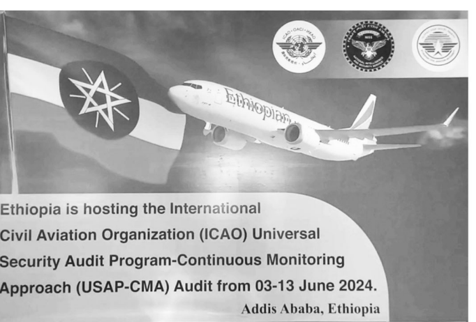
Ethiopia is hosting the International Civil Aviation Organization (ICAO) Universal Security Audit Program-Continuous Monitoring Approach (USAP-CMA) Audit from 03-13 June 2024. Addis Ababa, Ethiopia

አዲስ አበባ፡- በአቪዮሽን ደህንነት (ሴኪዩሪቲ) ዘርፍ በተከናወኑ የሪፎርም ሥራዎች ተጨባጭ ውጤቶችን ማስመዘገብ መቻሉ ተገለጸ። ኢትዮጵያ ለመጀመሪያ ጊዜ ለምታስተናግደው ሀገራዊ የአቪዮሽን የደህንነት አዲት የማስጀመሪያ ሥነ-ምርጫ ትናንት ተካሂዷል።