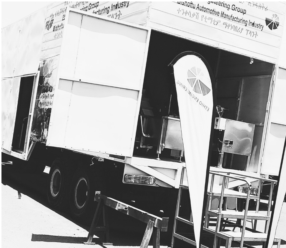
ማቀነባበሪያው በሰዓት 500 ኪ.ሎ ግራም ቲማቲም መፍጨት ይችላል

ይህን ማሽን ገዝቶ መስራት የሚፈልግ ባለሀብት ካለም ባለሀብቱ ተጠቃሚ ይሆናል ሲል ጠቅሶ፣ ይህን ሲያደርግ እሱ ብቻ አይደለም ተጠቃሚው፤ የሚቀጥራቸው ሰራተኞችም ይጠቀማሉ ብሏል።