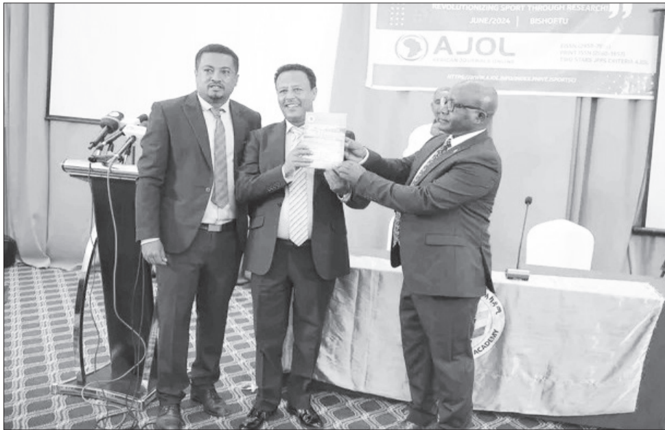
አካዳሚው በአትሌቲክስ ስፖርት የምልመላና ምዘና ሞዴል ሲያዘጋጅ በቀጣይም በአገር ካሉ ቅርጫት ካሉ ስፖርቶች ላይ መሰል ስራዎችን ይከናወናል።