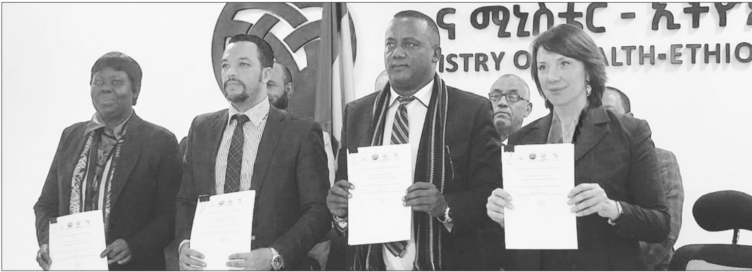
የ250 ሚሊዮን ዶላር ፕሮጀክት ይፋ ሆኗል።