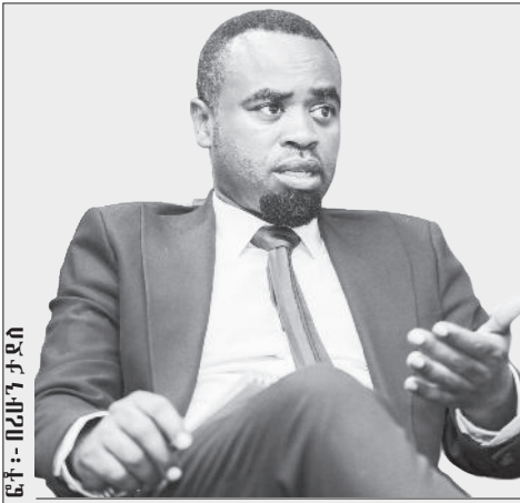
ፊት - በሪፖርተር ታደሰ