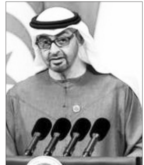
ሼክ መሀመድ ቢን ዛይድ ፡

ላቸው፤ “የፍልስጤማውያንን ሰቆቃ ያበዛው ጦርነት መቋጫው ሳይታወቅ ሊቀጥል አይጋባም”