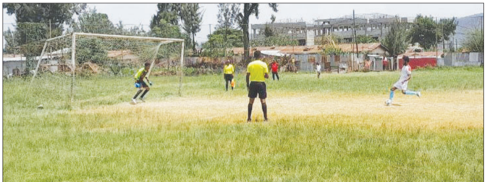
የሠራተኛው የቦጋ ወራት የአግር ኳስ ውድድሮች በጠንካራ ፍትህኛ ታደሰው በአንገ የመጨረሻ ምዕራፍ ላይ ይገኛሉ።

ጥር 19/2016 ዓ.ም በኢትዮጵያ ወጣቶች ስፖርት አካዳሚ የተጀመረው የሠራተኛው የቦጋ ወራት ውድድር ባለፉት ወራት በተለያዩ ማዘውተሪያ ሥፍራዎች ሲካሄዱ ቆይተው ወደ ወሳኝ ምዕራፍ ተሸጋግረዋል። በኢትዮጵያ ሠራተኛ ማህበር ኮንፌዴሬሽን(አሥማኮ) አዘጋጅነት የሚካሄዱት እነዚህ ውድድሮች በመጨረሻ ሰኔ ወር ይጠናቀቃሉ ተብሎ የሚጠበቅ ሲሆን በተለያዩ የስፖርት ዓይነቶች የሚደረጉ ፍትህኛዎች ወደ ፍፃሜ እየመሩ ይገኛሉ። በሁለት ዲቪዥን ተከፍሎ በሚካሄደውና ጠንካራ ፍትህኛ በሚያስተናግደው አግር ኳስ በሁለተኛ ዲቪዥን ሲካሄዱ የቆዩ ጨዋታዎች ተገባደዋል። በዚህ ዲቪዥን የፍፃሜ ተፋላሚ የሆኑ ሁለት ክለቦችም ባለፈው ሳምንት የግማሽ ፍፃሜ ጨዋታቸውን አድርገው ተለይተዋል። በዚህም ቃላት ብረት ብረት ፋብሪካ አዋሽ ወይን ፋብሪካን በግማሽ ፍፃሜው ፍለጋው 3ሰኛ በመርታት የፍፃሜ ተፋላሚ መሆኑን አረጋግጧል። በተመሳሳይ ጠንካራ ፍትህኛ በተደረገበት የግማሽ ፍፃሜ ጨዋታ ኢስት አፍሪካ ቦትሊንግ ኮከ ኮላ ሞኔንኮ ኩባንያ ጋር በመለያ ምት 10 ለ 9 አሸንፎ ወደ ፍፃሜ ያለፈ ቡድን ሆኗል። በውድድሩ ፍፃሜም ቃላት ብረት ብረትና ኢስት አፍሪካ ቦትሊንግ የሁለተኛ ዲቪዥን ፍፃሜን ለማንሳት የሚፋለሙ ይሆናል። በግማሽ ፍፃሜው የተሸነፉት አዋሽ ወይን ፋብሪካና ሞኔንኮ ኩባንያ ደግሞ በመጨረሻው አሁኖ በጎፋ ካፕ ሜዳ የሚገኙ ይሆናል። በጉጉት የሚጠበቀውና ጠንካራ ፍትህኛ የሚያስተናግደው የአንደኛ ዲቪዥን የአግር ኳስ የዙር ውድድርም በወሳኝ ምዕራፍ ላይ ይገኛል። ዘጠኝ ክለቦች ሲፋለሙበት