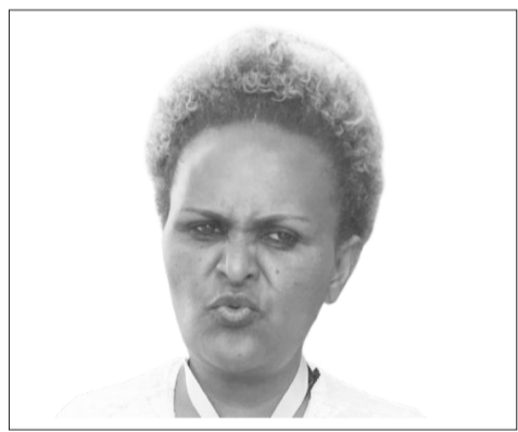
የስምዖን ወይዘሮ ገጠህ