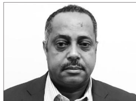
የሐንሰ በንቲ (ዶ/ር)

ሰላማዊ አካባቢን ይፈጸሳል ያሉት ፕሬዚዳንቱ፤ ሰላማዊ አካባቢን ለመፍጠር ማኅበሩ በመገናኛ ብዙሃን፣ በምክክር ቤቶችና በሌሎች የውይይት መድረኮች አማካኝነት አስፈላጊውን ትብብር እያደረገ ይገኛል ሲሉ ገልጸዋል።