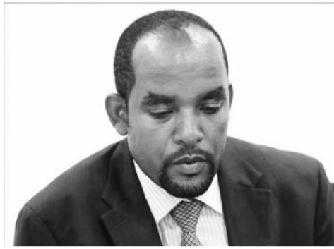
ተሻለ በሬቻ (ዶ/ር)