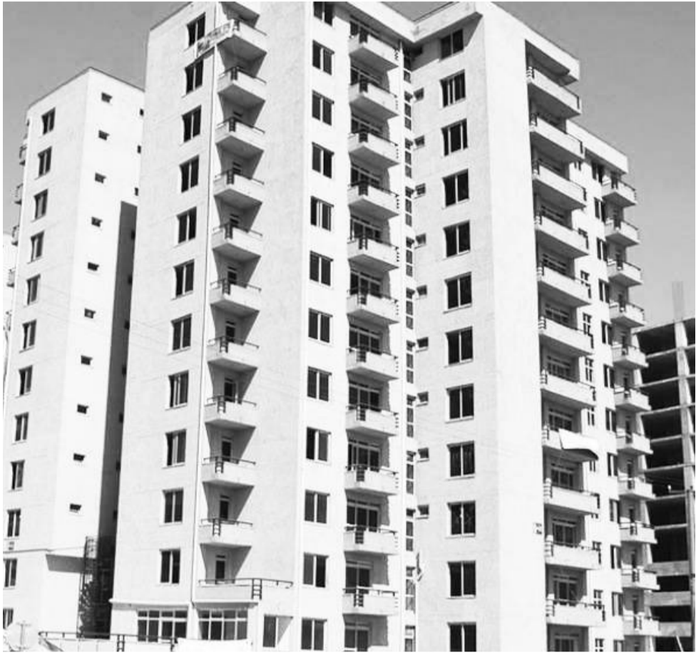
በኩል አዋጁ ተገቢ ነው የሚል እምነት እንዳላቸው አመልክተዋል።