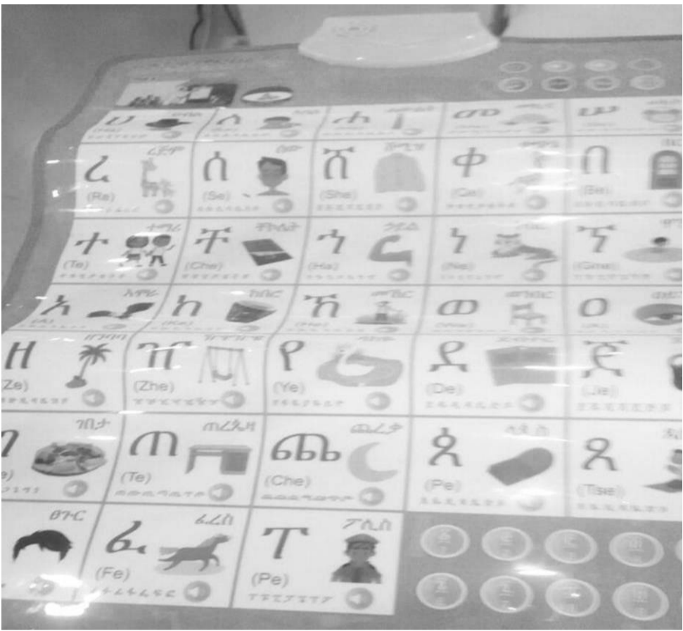
የአማርኛ ባለድምጽ የፊደል ገበታ

«በዚህ የባለድምጽ ፊደል ገበታ ማስተማሪያ አማካኝነት ሕፃናት ሦስቱን ማለትም አማርኛ የማዳመጥ፣ የማንበብ እና የመናገር ክህሎቶቻቸውን ማሳደግ ይችላሉ» የሚለው ዘርባቤል፤ የተቀረውን አራተኛውን የመጻፍ ክህሎት ደግሞ በቤታቸው ሆነው እዚያው በፊደል ገበታው ላይ ባለው በነጭ ሰሌዳ (ኃይት ቦርድ) ላይ ጻፈው በመለማመድ እያንዳንዱን