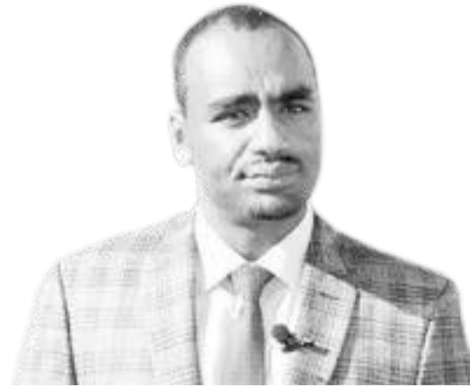
አሳምነው ተሾመ (ዶ/ር)