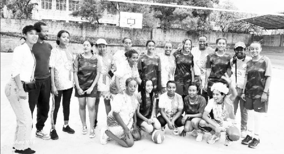
የሥራተኞች የበጋ ወራት ውድድሮች በተለያዩ የማዘውተሪያ ሥፍራዎች ጥሩ ፍክክር እያስተናገዱ ይገኛሉ።

በዚህም ሥራተኞች በጥሩ የስፖርት ስሜት የአርስ በርስ ግንኙነታቸውን እያጠናከሩ ስፖርቱን ለጤና፣ ለወዳጅነትና ለምርጫማነት ብሎም ለሰላም እየተጠቀሙት እንደሚገኙ