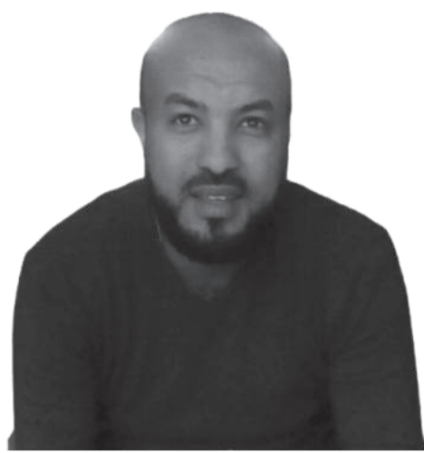
ክት በላይ ንጉሴ