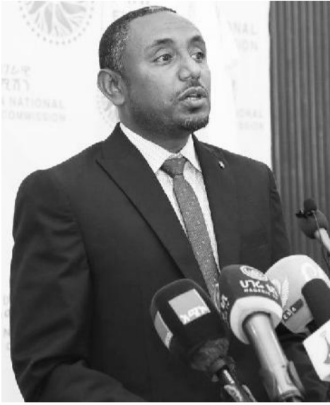
ሕገ ጥበብ ታደሰ