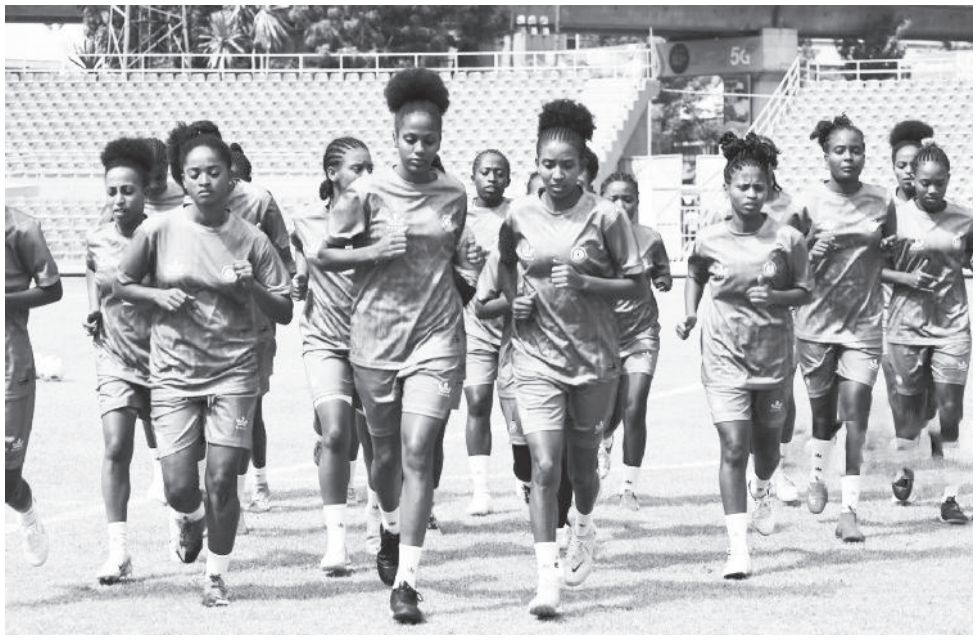
ቡድኑ ወሳኝ የዓለም ዋንጫ ማጣሪያ ጨዋታ ከኬንያ ጋር ይደርጋል።

በደራሲነት ሪፖርተር አዘጋጅነት በተያዘው የፈረንጅቹ ዓመት መጨረሻ የሴቶች ከ17 ዓመት በታች የዓለም ዋንጫ እንደሚካሄድ ይታወቃል። በየሁለት ዓመቱ የሚደረገው ይህ የዓለም ዋንጫ ዘንድ ለ8ኛ ጊዜ የሚከናወን ነው። ከየአሁን-ሁሉ በዚህ መድረክ መሳተፍ የሚችሉ ሀገራትም የማጣሪያ ጨዋታዎችን በማድረግ ላይ የሚገኙ ሲሆን፤ የአፍሪካ አግር ኳስ ኮንፌዴሬሽን (ካፍ) በሚመራው ማጣሪያ ሦስተኛው ዙር ከቀናት በኋላ ይደረጋል። በዚህ ዙር የደርሶ መልስ ጨዋታ ከሚያደርጉት መካከል አንዱ የሆነው የኢትዮጵያ ከ17 ዓመት በታች ብሔራዊ ቡድንም ከኬንያ አቻው ጋር ይጫወታል።