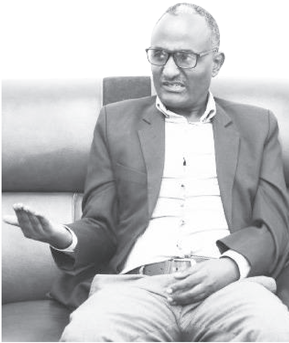
ፊት - ሐዲስ ስብርሃ

«ከማራ አዲስ» ከሚባል ድርጅት ጋር በመተባበር 42 ለሚሆኑ ትምህርት ቤቶች ለእያንዳንዳቸው 25 ኮምፒውተሮችን ሰጥተናል። ኮምፒውተሮቹ በእያንዳንዱ ትምህርት ቤት የሚሰጡ የትምህርት ዓይነቶች የተጨማሪባቸው ናቸው። በዚህም