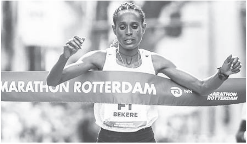
አትሌት አሸቱ በከሪ ለሁለተኛ ጊዜ የሮተርዳም ማራቶንን አሸናፊ መሆን ችሏለች።

በውድድሩ ጠንካራ ተገኝቶቻቸውን ያሳዩት ኬንያውያኑ አትሌቶች ቪዮላ ኪቢዮት በ2:20:57 ሁለተኛ እና ሳሊ ቼፕግን ካፕቲቲ በ2:22:46 ሶስተኛ ሆነው ውድድራቸውን አጠናቀዋል።