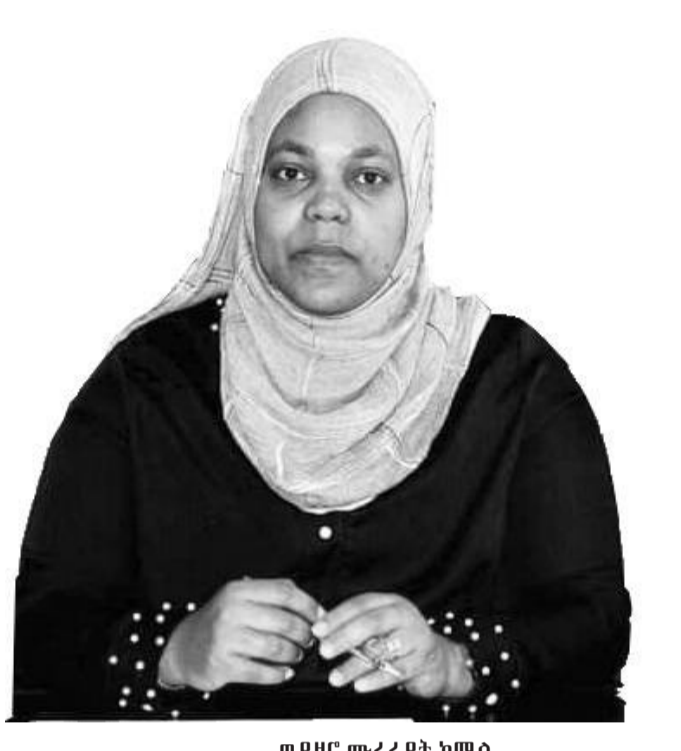
ወይዘሮ ሙፈሪያት ካሚል