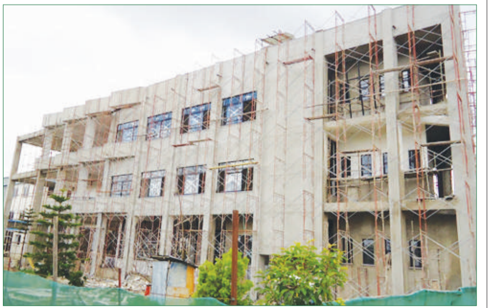
አየተጠናቀቀ ያለው ሕንጻ

አደጋ ጠቋሚ መሳሪያ (Fire alarm System) ፣ ኤልክትሮ ሜካኒካልና ኢዲዮ ቬዥዋል ሲሰተም አሉት። ከዘመናዊ የትምህርት አሰጣጥ ጋር የተያያዙ የትምህርት አሰጣጥን ለማሳለጥ የሚረዱ ዲጂታል ሲስተሞች MATV እና CCTV ተዘጋጅቶላቸዋል። ከዚህ በተጨማሪ ለአካል ጉዳተኞች ብቻ የተዘጋጀ፣ ራሳቸው እየተቆጣጠሩ ከሚፈልጉበት ወለል የሚያደርሳቸው አሳንሰር ተዘጋጅቷል። ለተመረጡ ክፍሎች ከክፍሉ ሠራተኛው ወጪ እንዲገባ የሚከለክል በር (Access control door) ሲሰተም ይገጠማላቸዋል።