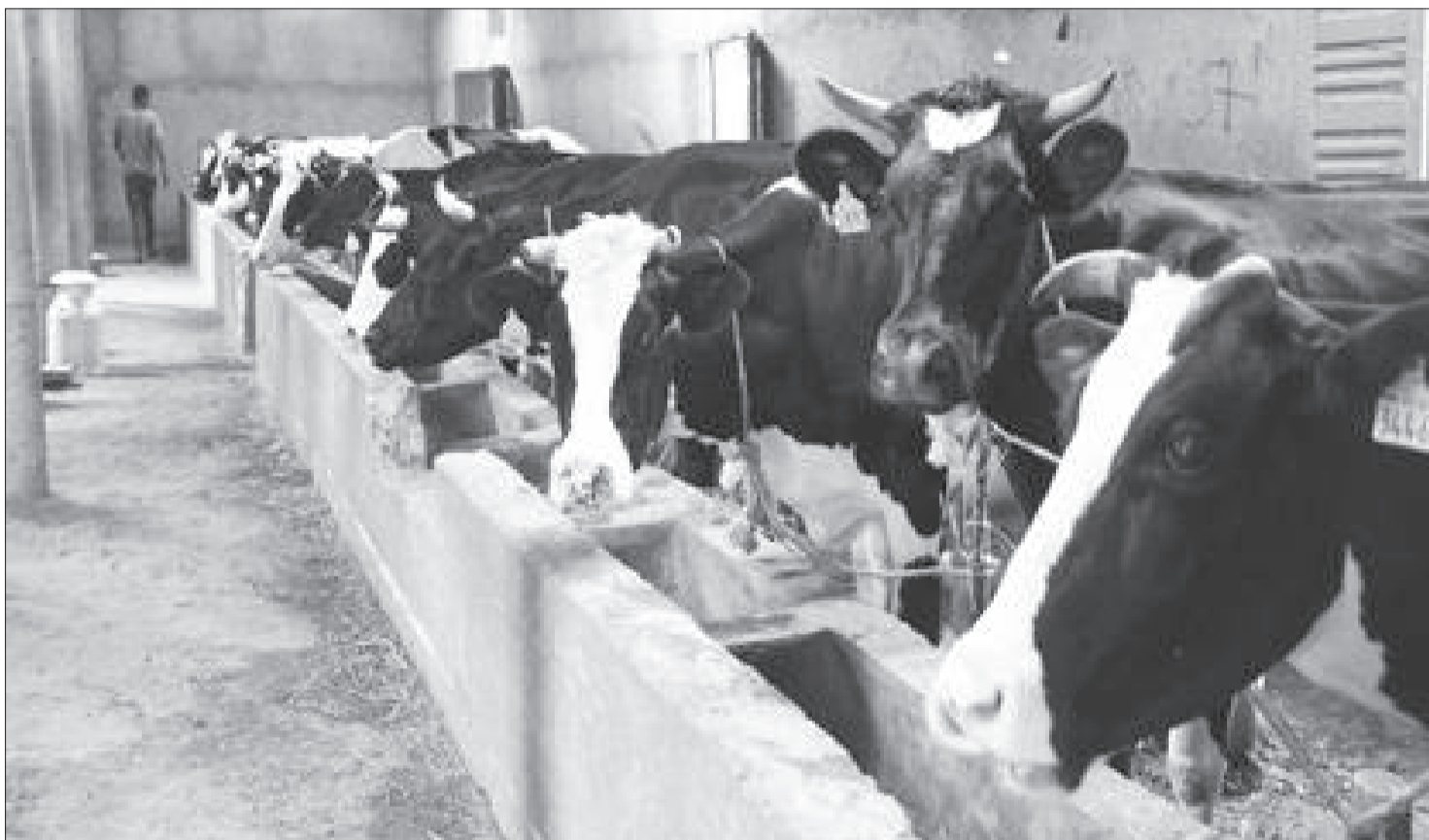
በጥምር ግብርና ኢንቨስትመንት በቀን 300 ሊትር ወተት እየተመረተ ነው

ልማት ምቹ መሆኑን ተገነዘበ። የዓለም የወተት ቀን ሲከበር በተመለከቱት መሠረት የተሻሻለ ዝርያ ያላቸው ከብቶች ለልማቱ ወሳኝ መሆናቸውን ተረዱ። በሌላ በኩል ባለሙት ጫካ ውስጥ ያለው የጣጦች ሣር ጋር ተዳምሮ አሳቸውም በወተት ሃብት ልማት ቢሠማሩ ውጤታማ ሊሆኑ እንደሚችሉ አመኑ።