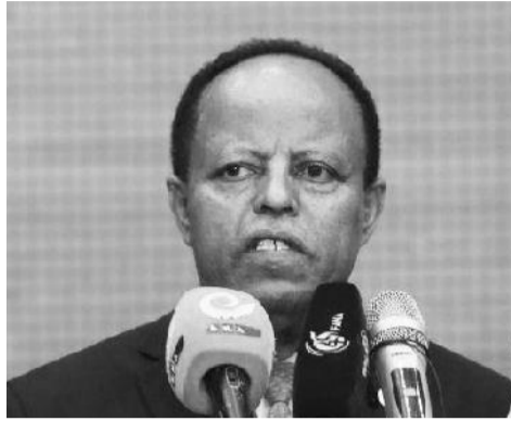
አምባሳደር ታዩ አጽቀሥላሴ