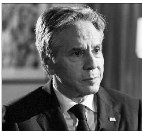
አንቲ ብሊንኮን ሩስያ መሳሪያ ሽያጭ ጋር በተያያዘ በአምስት የምዕራባውያን የመከላከያ ድርጅቶች ላይ ማዕቀብ እንደምትጥል ቻይና ማስታወቂያ ይታወሳል። እንዲሁም ባለፈው

በሁለቱ ሀገራት መካከል ዋነኛው ጥረት መሻሻላቸውን የቆየው ቻይና ታይዋንን እንደ አንድ ግዛቷ መመልከቷ ሲሆን፤ በቅርቡ አሜሪካ ለታይዋን ካካሄደችው የጦር