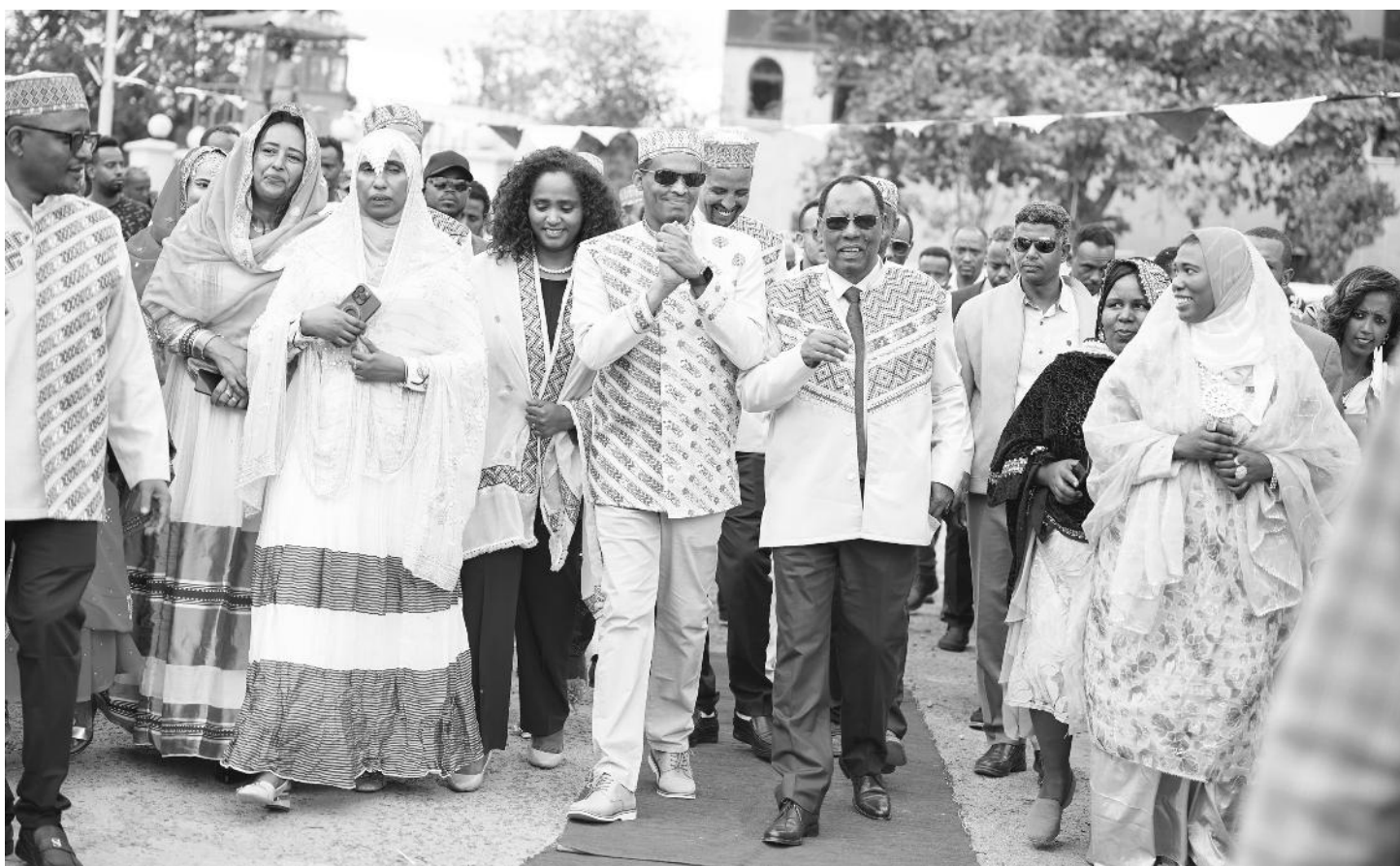
የዘንድሮው የሸዋልኤድ በዓል በሀረር ከተማ በደማቅ ሥነ ሥርዓት ተከብሯል