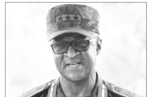
ጄኔራል ፍራንሲስ አጎላ አዲንጋም አደጋውን " የኬንያ አሳዛኝ ቀን" ሲሉ ገልጸውታል።

ፕሬዚዳንቱ ዋና የጦር አማካሪዎቻቸው በግዳጅ ላይ እያሉ ሕይወታቸው ማለፉን ገልጸዋል። " እናት ሀገራችን ጀግና የሆኑ ጄኔራሎቻችን፣ የጦር መኮንኖቻችን፣ ወታደሮቻችን አጥታለች" ሲሉ ለኔሽን ጋዜጣ ተናግረዋል። የተቃዋሚ ፓርቲ መሪው ራይላ