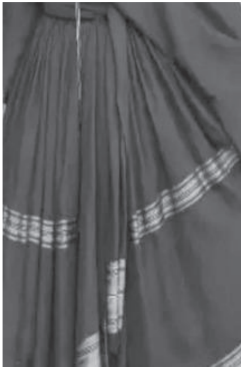
ንክር የሀገር ቀሚሶ

ዲዛይነር የኔቪስ፣ ወደዚህ ሙያ ከገባች 14 ዓመታት ገደማ ተቆጥሯል። በቀለም የተነከረ የሀገር ልብሶ በመስራት ይበልጥ ትታወቃለች። የምትሰራቸውን የሀገር ልብሶች በቀለም በመንከር በተለያዩ አማራጭ እየሰራች ለገበያ ታቀርባለች። ከዚህም በተጨማሪ የሀገር ቀሚሶችን፣ ቶፖችን እንዲሁም ለሴት እና ለወንድ የሚሆኑ ልብሶችን ትሰራለች። እንዲሁም ለሕጻናት የሚሆኑ የሀገር ልብሶችን በተለያዩ ዲዛይንና አይነት ትሰራለች። አሁን ላይ ደግሞ ተደራሽነትን በማስፋት የአልጋ ልብሶ፣ የጠረጴዛ ልብሶች እና እንደ ሱናት የሚያገለግሉ ልብሶች በተለያዩ ዲዛይን