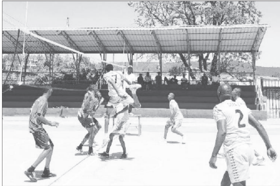
በሠራተኛው ስፖርት ጠንካራ ፉክክር ከሚታይባቸው ውድድሮች አንዱ የሆነው ነው።

በሠራተኛው ስፖርት አገገ ፉክክር ከሚደረግባቸው ስፖርቶች አንዱ የሆነው በወንዶች አግር ኳስ ባለፈው ሳምንት ስድስት ጨዋታዎች ተካሂደዋል። አዲስ አበባ ውሃና ፍሳሽ የኢትዮጵያ አየር መንገድን ሰፊ በሆነ የገለበጠው የረታበት ጨዋታ አንዱ ሲሆን፣ መከላከያ ኮንስትራክሽን ማህበራት ሲሚንቶን 5ላቢ ያሸነፈበት ጨዋታም በበርካታ ግቦች የተመዘገቡበት የሳምንቱ መርሀ ግብር ነበር። በተመሳሳይ የኢትዮጵያ ባህር ትራንስፖርትና ሎጀስቲክስ ከ ሞዴንኮ ኩባንያ ያደረጉት ጨዋታ ጠንካራ ፉክክር በማስተናገድ ሰባት ግቦች ከመረብ ያረፉበት ሲሆን፣ ባህር ትራንስፖርት 4ላ3 በሆነ ውጤት ማሸነፍ ችሏል። ኢትዮጵያ ግብርና ሥራዎች ከ አስት አፍሪካ ቦትሊንግ ያደረጉት ጨዋታም ተመጣጣኝ ፉክክር የታየበትና 2ላ2 በአቻ ውጤት የተጠናቀቀ ነው። የአዲስ አበባ ከተማ