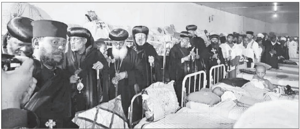
አስፈላጊውን እገዛ እንደምታደርግም ገልፀዋል።

የኢትዮጵያ ኦርቶዶክስ ተዋሕዶ ቤተክርስቲያን ለዚህ ትልቅ ዋጋ ያለው ተግባርም ለመቆይን በፀሎት እና