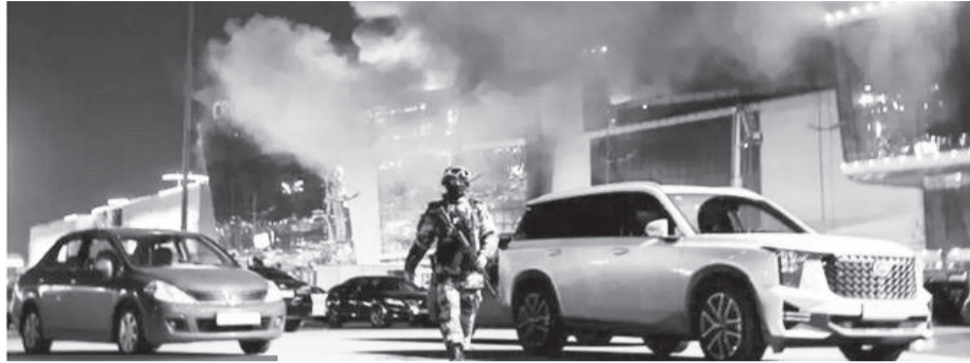
አንድ የዐይን እማኝ ተናግሯል።

ፒክኒክ የተሰኘው ታጣቂው የሮክ ባንድ ሙዚቃን ለመታደም ስድስት ሺህ የሚሆኑ ሩሲያውያን በክሮክስ ሲቲ ሆል ተገኝተው ነበር። ጥቃቱ የተከፈተውም ባንዱ ወደ መድረክ ከመምጣቱ ከደቂቃዎች በፊት እንደሆነ