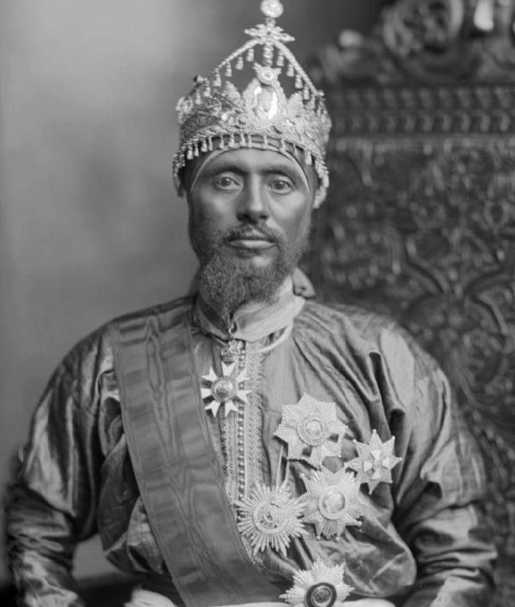
ራስ መኮንን ወልደሚካኤል

ጦርነት ሲሆንም ልዑል ራስ መኮንን ሠራዊታቸውን ይዘው ከአምባላሌ አስከፊ ዓድቆ በተደረጉት ውጊያዎች ላይ በመሳተፍ ታሪክ የማይዘነጋው ታላቅ ጀግንነታቸውን አስመስክረዋል። ልዑል ራስ መኮንን ከቤተ መንግሥት ባለሟልነት ጀምረው በወታደርነት፣ በጦር መሪነት፣ በግዛት አስተዳዳሪነትና በዲፕሎማትነት በፈጸሟቸው አኩሪ ተግባራት ምክንያት ንጉሥ ነገሥት ዳግማዊ አጼ ምኒልክ የዙፋናቸው ወራሽ እንደሚደርጋቸውም ይወራ ነበር።