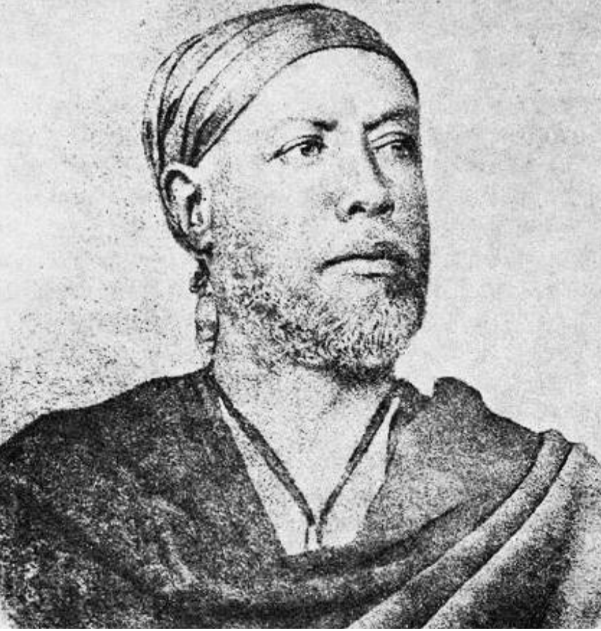
ራስ ዳርጌ ሳህሊሥላሴ

ዳግማዊ አጼ ቴዎድሮስም አቤቶ ዳርጌን የሸዋ ገዢ አድርገው እንደሸው ተናገሩ፤ ነገር ግን ዳግማዊ አጼ ቴዎድሮስ የራስ ዳርጌን የጦር ሰፈር ሲመለከቱት በጣም የደመቀና የተደራጀ ስለነበር በጣም ተጨነቁ። ንጉሥ ነገሥቱም አቤቶ ዳርጌን አስጠርተው «ዳናዬ ፈራሁህ! በጥንድ ጦር የሚሰተውን ኃይሉን ሽራ በነጠላ ጦር ደርሰህ ሁለት ሰው የምትገለውን አንተን በሸዋ ላይ አልሾምም» ብለው