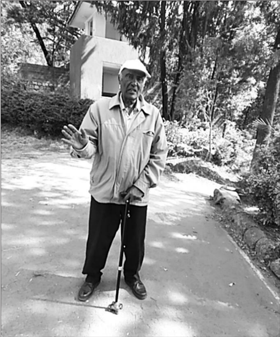
ወታደር ላቀው ኪዳኔ

ስለ ጦርነቱ መንስኤ በሰፊው እየዘረዘሩ ያስረዱን ገብተዋል። የአንቀጽ 17ቱ መዘዝ በ1887 ዓ.ም በወርሀ መስከረም በገበያ ቀን ቅዳሜ አፄ ምኒልክ ታሪካዊውን የ «ወረ ኢሉን» ክተት አዋጅ «...አገርንና ሃይማኖት