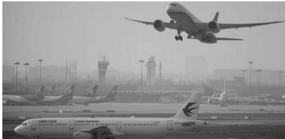
ከኮቪድ 19 በፊት የቻይና ስድስት መንገዶች ወደ አሜሪካ የሚያደርጉት ሳምንታዊ በረራ 150 ነበር