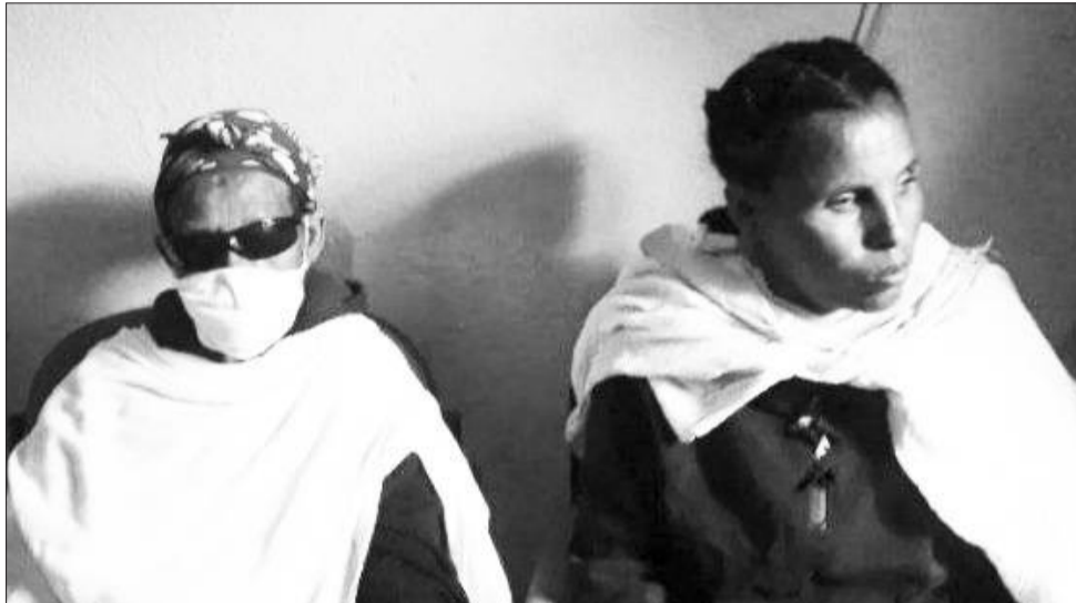
ማህበሩ የሴት ዓይነ ስውራንን ሕይወት ለማሻሻል ድጋፍ ይደረጋል።