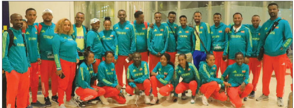
በቤት ውስጥ የዓለም ቻምፒዮና ኢትዮጵያን የሚወክሉው ብሔራዊ ቡድን ከትናንት በስተቀ ወደ ግላስኮ ስቅጥቷል።

በውድድሩ ላይ ከሚካሄዱት 651 አትሌቶች መካከል 331 የሚሆኑት ሴቶች ሲሆኑ፤ 320ው ደግሞ ወንዶች ናቸው። ከእነዚህም ውስጥ 18ቱ በቤልግሬዱ ውድድር ላይ ቻምፒዮና የነበሩ ስመጥር አትሌቶች ናቸው። ኢትዮጵያን ወክለው በውድድሩ ላይ