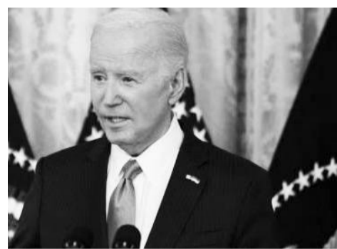
እሥራኤልና ሃማስ በተናጠል ከኳታር እደራዳሪዎች ጋር በዶሃ እያደረጉት ያለው ምክክር ተስፋ ሰጪ ነው ተብሏል

የእሥራኤል ጠቅላይ ሚኒስትር ቤኒያሚን ኔታንያሁ በበኩላቸው ሀገራቸው የተኩስ አቋም ስምምነት ለመድረስ ዝግጁ ብትሆንም ሃማስ ያስቀመጣቸው ቅድመ ሁኔታዎች