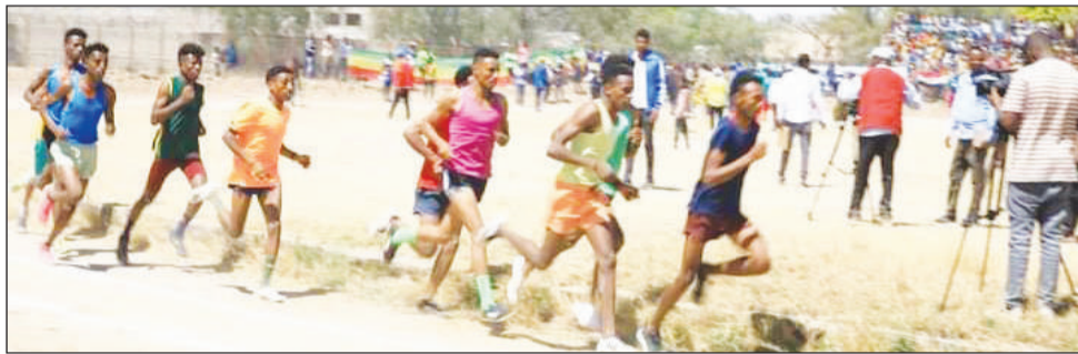
ውድድሩ በጠንካራ ፉክክር ታይቦ ቀጥሏል።