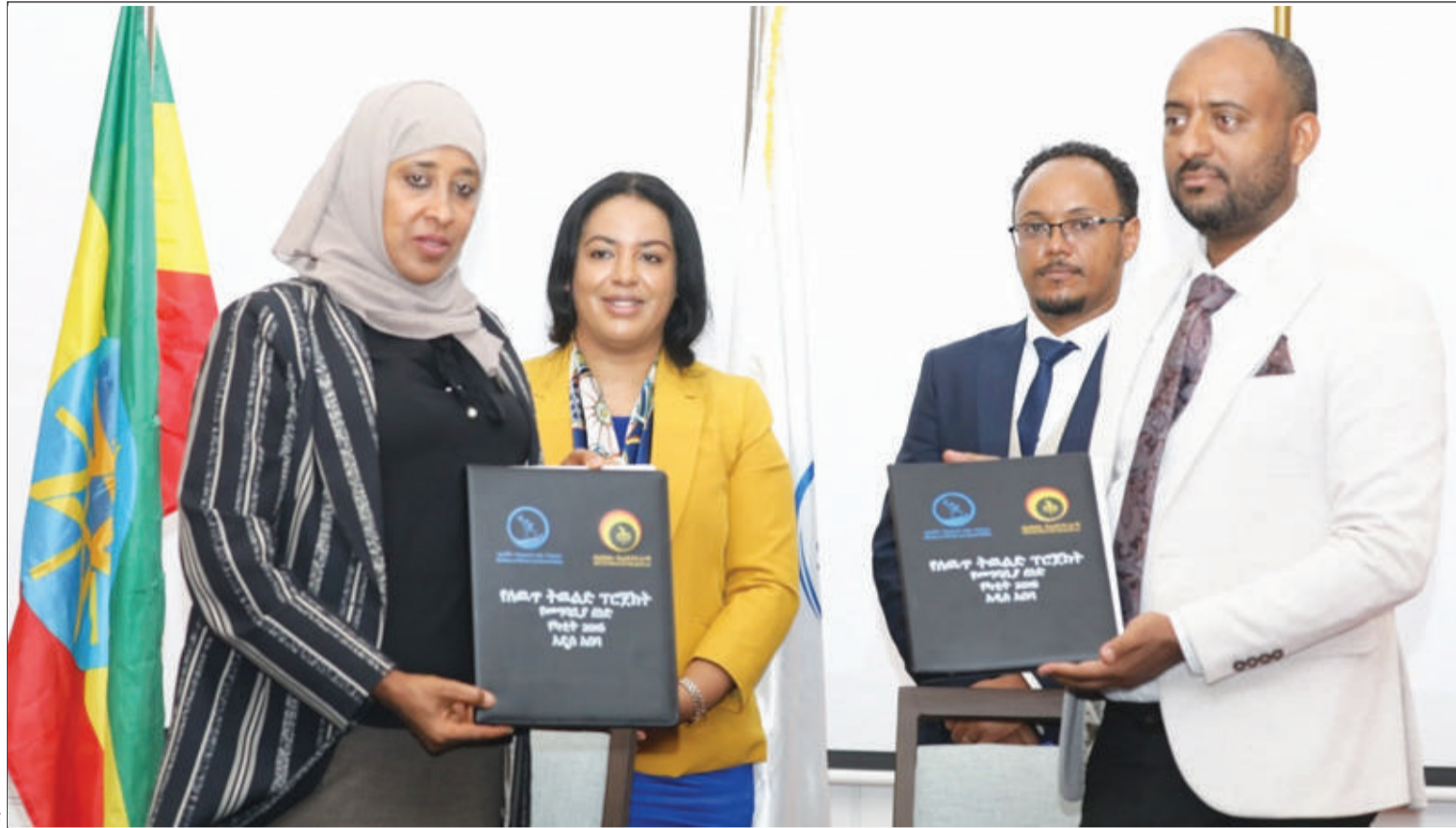
የሰው ጥንቃቄ ፕሮጀክት በስምንት ዓመታት ተግባራዊ ይደረጋል