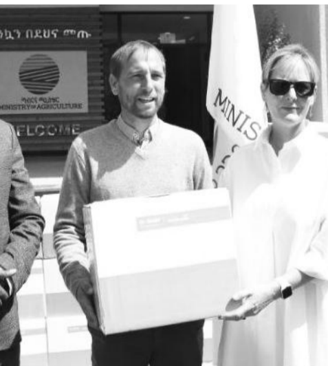
ድጋፍ በግጭትና ድርቅ ለተጎዱ አርሶ አደሮች ይውላል

ድርጅታቸው ትግራይና አማራ ክልል የሚገኙ በግጭትና ድርቅ የተጎዱ አርሶ አደሮችን መልሶ ለማቋቋም የሚያደርገውን ድጋፍ አጠናክሮ እንደሚቀጥል አሰታውቀዋል።