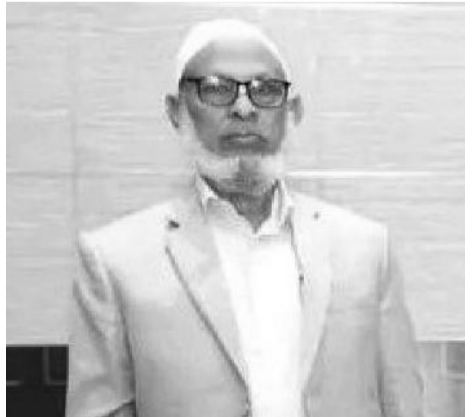
ሼክ ሳህ ሀሰን ኤብራሂም