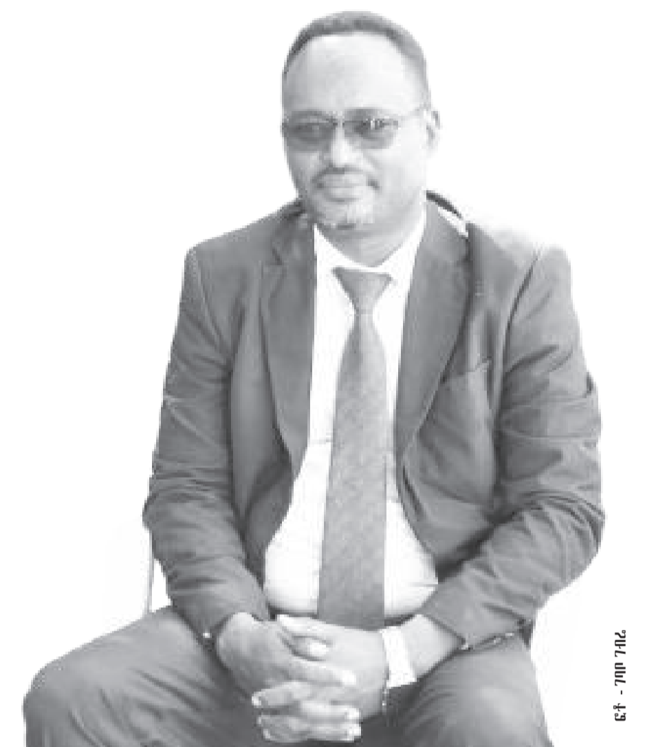
ፎቶ - ገጠ 7ብሬ

በአርብቶ አድርገን ሆነ አርሶ አደር አካባቢ ይህን ተግባራዊ አድርገን ወጣቶች ተጠቃሚ ሆነዋል። እያንዳንዱን ሥራ በኃላፊነት የምንሰራው መሆኑን በሚገባ ማጤን ይገባል። በብዛት እየሰራን ያለነው