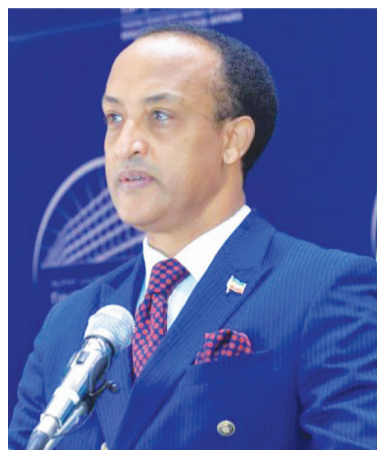
አምባሳደር መስላሴ ዓለም (ዶ/ር)