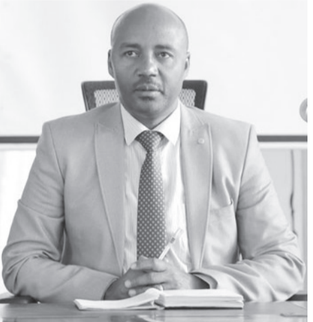
ስተ በዩን በራሳ

ሲሠሩ፤ 3ሺ 770 የሚሆኑ ክፍሎች ደግሞ እድሳት ተደርጎላቸዋል። በተጨማሪም 39 አዲስ ቤተ መጻሕፍት የተገነቡ ሲሆን፤ 248 ነባር ቤተመጻሕፍቶች እድሳት ተደርጎላቸዋል፤ 34 አዳዲስ የውሃ መስመሮችንም መዘርጋት ተችሏል።