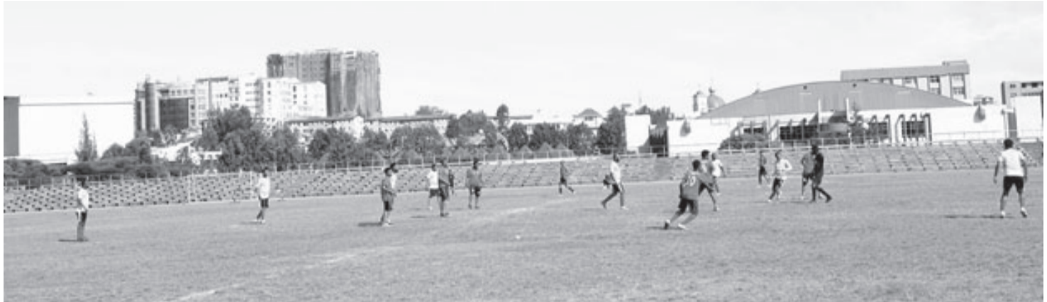
ስፖርታዊ ውድድሮች የሠራተኛን ስልጠና ለማሳደግ ማድረግ የሚችሉ ናቸው።

በ1990 ዓ.ም የተዘጋጀው የኢትዮጵያ የስፖርት ፖሊሲ ስፖርታዊ እንቅስቃሴ ማድረግ የዜጎች መሠረታዊ መብት መሆኑን ይጠቁማል። በትኩረት አቅጣጫውም ኅብረተሰቡ በሚኖርበት፣ በሚማርበትና በሚሰራበት አካባቢ በባህላዊ ስፖርቶችና በስፖርት ለሁሉም ተሳትፎውን የሚያጎለብትበትም ሁኔታ ይመቻቻል። ከአፈጻጸም ስልቶች መካከልም በመሥሪያ ቤቶች አካባቢ ከሠራተኛ ማህበራት ጋር የአሠራር ቅንጅት በመፍጠር በሥራ አካባቢ እንዲሁም በተለያዩ ስፖርታዊ እንቅስቃሴዎች እንዲሳተፍ ማድረግን ያካትታል። ከተሳትፎ ባለፈ የስፖርት ቡድኖችን በማቋቋም ማወዳደርንም ያበረታታል።