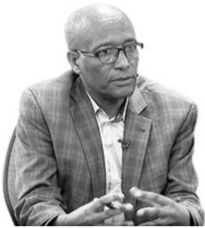
ስተ ፍቃድ ደፈረስ