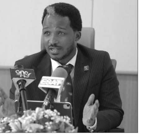
ይሹሩን ዓለማየሁ (ዶ/ር)

የዲጂታል ሳምንት ዝግጅትም ለማህበረሰቡ የኢትዮጵያን የዲጂታል ትራንስፎርሜሽን ሥራዎች