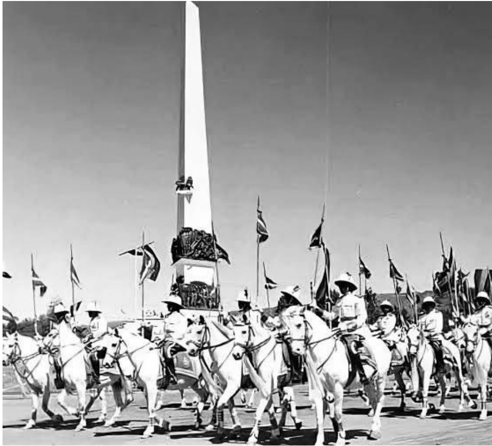
የካቲት 12 የሰማዕታት መታሰቢያ ሐውልት።

ከመሄዳቸው በፊትም እንዲህ አደረጉ። በአብርሃም ደብጭ ቤት ውስጥ የጣሊያንን ባንዲራ በሳንቃ ወለል ላይ አንጥፈው ሚስጥር ገደጉበት። የጣሊያን ፋሽስት ጉዳን አላየ! እዚያ ሽር ጉድ ይላል። አብርሃም እና ሞገስም