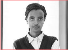
ተማሪ ቤተሰብ የቀመጠች