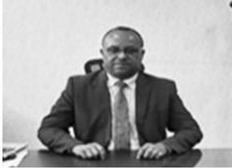
ሸቶ ደዳ ዲሪባ

አዲስ አበባ፡- በአዲስ አበባ ከተማ ባለፉት ስድስት ወራት አካባቢ ላይ ብክለት ያደረሱ ከአንድ ሺ በላይ ተቋማት ላይ ርምጃ መውሰዱን የአዲስ አበባ ከተማ አካባቢ ጥበቃ ባለሥልጣን አስታወቀ። የማኅበረሰቡን የእረፍት ጊዜ ያወኩ 25 ጭፈራ ቤቶች መታሸጋቸውም ተገልጿል።