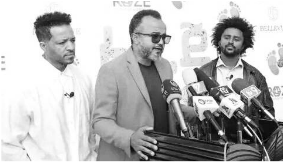
በሕዝብ ገንዘብ በሚሠራው የመጀመሪያ ፊልም ከ4 ሺህ ሰው በላይ እንደሚሳተፍ አዘጋጅቶ ገልጸዋል።

ባለሀብቶች ፕሮዲዩሽን ማድረጋቸው ባልከፋ፤ ግን ደግሞ ሌላ ያስከተለው ጠስም አለ። የፊልም ኢንዱስትሪው እራሱን ችሎ እንዳይቆም አድርጎታል። እንዴት? ሲባል ከፊልሞቹ የሚገኘው ትርፍ በሙሉ ተጠራርን የሚገባው ወደ ኢንዱስትሪው ሳይሆን ወደ ባለሀብቶቹ ፕሮዲዩሽኖች ኪስ ነው። ተረቱም፤ ላለው ይጨመርለታል' ነውና ከተዋገደን እስከ ትልልቅ ባለሙያዎች የሚያዋጣው የፊልሙ ኢንዱስትሪ