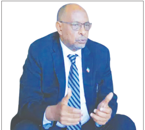
ዶክተር ሲሳ ካይድ መሐሙድ

ከእናንተ ጋር በፍቅር መኖር ብቻ ነው የምንፈልገው። ከዚህ የተለየ አጀንዳና ፍላጎት የለንም» በማለት ተናግረዋል። ለአማራ ክልል ትራክተር እንጂ ጥይት አያስፈልግም ያሉት ጠቅላይ ሚኒስትሩ፣ ለክልሉ ሰላም ተደጋጋሚ ጥሪ መቅረቡን ጠቅሰዋል። በሰላማዊ መንገድ ገብቶ መነጋገር የሚፈልግ ሰው መነጋገር መቻል እንዳለበትም አስታውቀዋል። «ሰላምና ልማትን ... ወደ ገጽ 4 ዞሯል