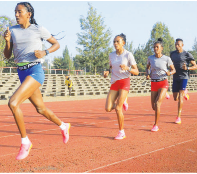
የኢትዮጵያውያን አትሌቶች የዓለም የቤት ውስጥ ቻምፒዮና ዝግጅት ቀጥሏል።

የቻሉ ኢትዮጵያዊያን አትሌቶች ከየካቲት 11/2016 ዓ.ም አንስቶ ልምምድ ማድረግ የጀመሩ መሆኑን የኢትዮጵያ አትሌቲክስ ፌዴሬሽን መረጃ ይጠቁማል። 8 ሴቶች እና 5 ወንድ በድምሩ 13 አትሌቶችን ያቀፈው ብሄራዊ ቡድኑ በኢትዮጵያ ስፖርት አካዳሚ መም ዝግጅታቸውን አጠናክረው ቀጥለዋል። ቡድኑ በውድድሩ የሚካፈልባቸው ርቀቶችም በሁለቱም ጾታ ሺ500 ሜትር እና 3ሺ ሜትር እንዲሁም በ800 ሜትር ሴቶች መሆኑ ታወቋል። በተለያዩ ርቀቶች የዓለም ቻምፒዮና፣ የክብረወሰን ባለቤቶችን፣ በውድድሩ ልምድ ያላቸውና ከዚህ ቀደም ውጤታማ የነበሩ እንዲሁም ወጣት አትሌቶችን ያቀፈው ቡድኑ እንዳለፈው ቻምፒዮና ውጤታማ እንደሚሆን ይታመናል። በቤት ውስጥ ቻምፒዮና ኢትዮጵያ የምትታወቀውና በተለይም ውጤታማ የሆነችው በሺ500 ሜትር ርቀቶች ሲሆን፤ የቻምፒዮናው ክብረወሰንም በሁለቱም ጾታዎች የተያዘ ነው። አስደናቂ የሆነው የ3ሺ ሜትር ወንዶች ክብረወሰን