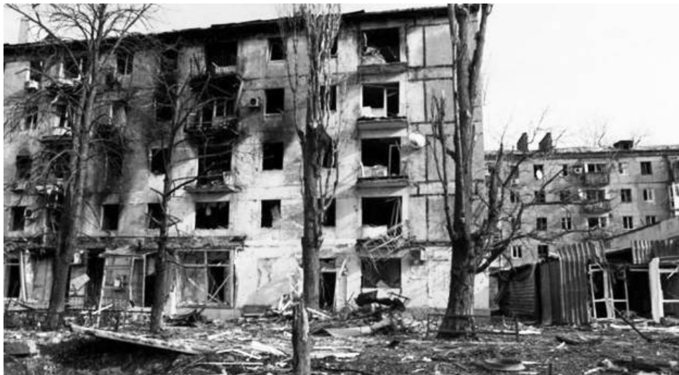
አብዳሞ ስብከት በመቀጠል ሰራሲያ ትልቅ ስትራቴጂካዊ ፋይዳ ያሳት ከተማ መሆኗ ተገልጿል