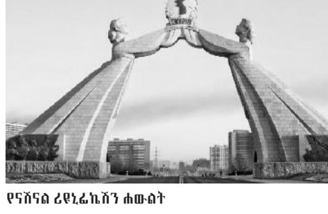
የናሽናል ሪፎኒሬኤሽን ሐውልት

ፕሬዚዳንቱ ሰሜን ኮሪያ ደቡብ ኮሪያን የምታጠቃ ከሆነ ከባድ ጥቃት ይገጥማታል ሲሉ አስጠንቅቀዋል። የኮሪያ ባህረ ሰላጤ ወደ ሁለት የተከፈለው ለአስርት ዓመታት የቆየው የጃጋን ቅኝ ግዛት በ1945 ከተጠናቀቀ በኋላ ነበር። ሰሜን ኮሪያ የባለስቲክ ሚሳይል መከራከርን በማጠናከሯ ምክንያት በሰሜን ኮሪያ እና በደቡብ ኮሪያ መካከል ያለው ውጥረት ከቅርብ ዓመታት ወዲህ አይሰል ሲል አል ዐይን ዘግቧል።