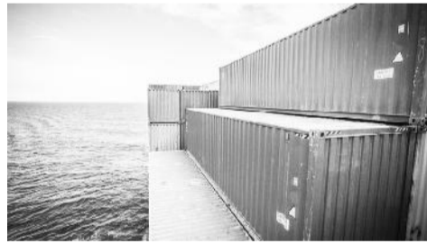
በጥቃቱ የከፋ ጉዳት አልደረሰም።

በቀይ ባሕር ሑቲዎች ጥቃት መስጠታቸውን ተከትሎ በርካታ ግዙፍ የመርከብ ኩባንያዎች ጉዟቸውን በሌላ አቅጣጫ ለማድረግ ተገደዋል። ይህ ደግሞ በዓለም የንግድ