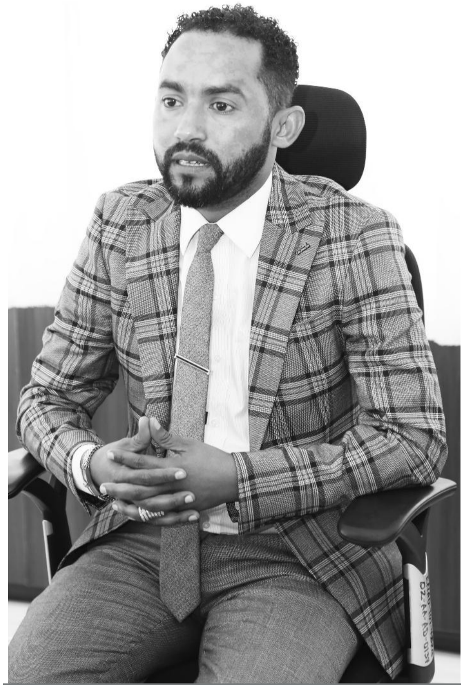
ፎቶ ጻፏል ስብረ

አቶ ወንድወሰን፡- በተለያዩ ምክንያቶች በቂ ነው ማለት አንችልም። የመጀመሪያው ዓለም አቀፍ ዕውቅና ያገኘንባቸው ወሰኖች ውስን ናቸው። ሌላው አገልግሎቱ አስገዳጅ ባለመሆኑ ነው። የእኛ ደንበኛ በእኛ አክሲዮን ለመደረግ አይገደድም። በማንኛውም ተቋም አክሲዮን ሊሆን ይችላል። አንዳንድ አካላት አስቸጋሪ ቢሆኑም፤