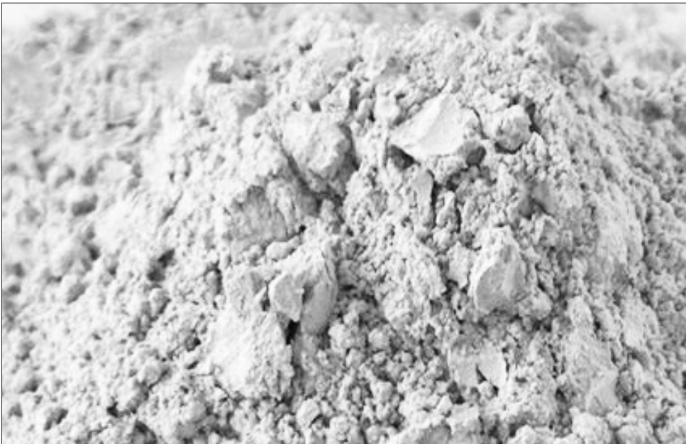
በአብያታና በሻላ ሐይቅ ከ380 ሚሊዮን ቶን በላይ የሚገመት የሶዳ አሽ ማዕድን ከምችት ይገኛል።

ሶዳ አሽ በሽርክት ወይም በደቀቀ መልኩ ተፈጭቶ ለገበያ ሊቀርብ እንደሚችል ጠቅሰውም፤ ለሳሙና እና ለዲተርጅንት፣ ለጨርቃ ጨርቅ፣ ለቆዳ፣ ለብርጭቆና ለወረቀት ፋብሪካዎች በጥሬ በግብዓትነት