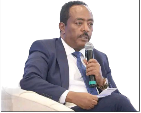
አምባሳደር ፊደላን ሁሴን