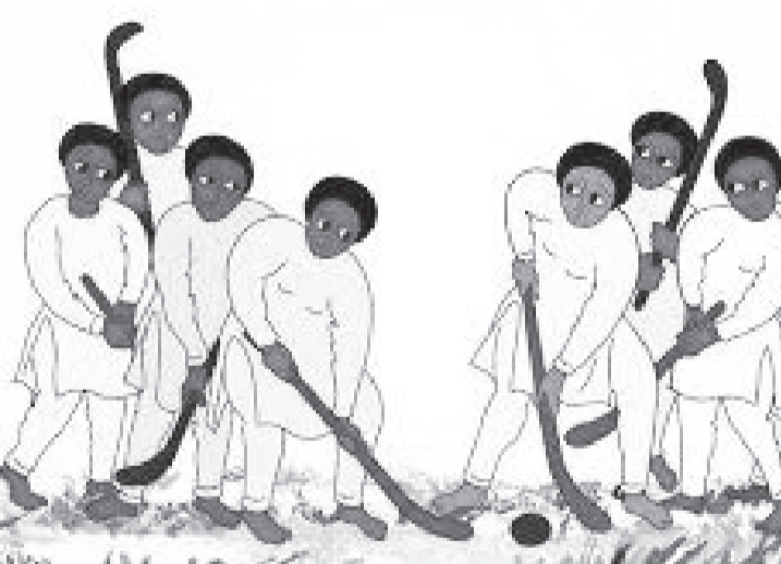
በገና ጨዋታ፣ ስደቅጡም ጌታ