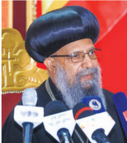
አበነ ማቴዎስ ቀዳማዊ ፓትሪያርክ