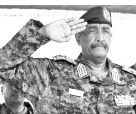
ቡርሃን፣ ሄሜቲ በአዲስ አበባ የፈረሙትን የተኩስ አቁም ስምምነት ውድቅ አድርገዋል

አሜሪካ እና ሳዊዲ አረቢያ ሁለቱን ተፋላሚ ኃይሎች ለማስታረቅ ያደረጉት ጥረት ውጤት አላሳኘም።