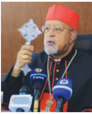
ብጹኅ ካርዲናል አበነ ብርሃነኢየሱስ