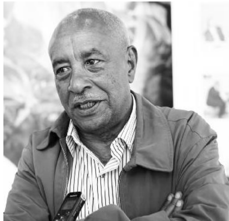
አቶ ወይዘሮ አስፋው፤