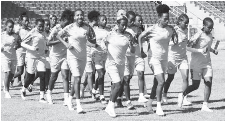
ቡድኑ ለዓለም ዋንጫ ተሳትፎ በቀረው የ90 ደቂቃ ሰደል መጠቀም ይገባዋል።

የዓለም ዋንጫ ተሳትፏቸው አጣብቂኝ ውስጥ የገባው የኢትዮጵያ ከ20 ዓመት በታች ሴቶች ብሔራዊ ቡድን ከነገ በስቲያ ወሳኙን ጨዋታ ያከናውናል። የወጣት ቡድኑ አበበ ቢቂላ ስታዲየም ላይ በሚያደርገው ጨዋታ የሞሮኮን ሽንፈት መቀጠል ከቻለም አፍሪካን በዓለም ዋንጫው ከሚወክሉ አራት ቡድኖች መካከል ይካተታል። ቡድኑ ዕድሉን ለማቅናት ካዛብላንካ ላይ የታዩ ድክመቶቹን በማስተካከልና ስህተቶቹንም በማረም በሀገሩ አየርና ደጋፊው ፊት የሚኖረውን የ90 ደቂቃ ቆይታ መጠቀምም ይጠበቅበታል።