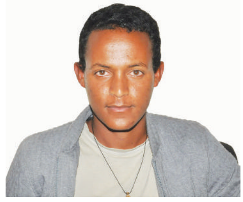
ወጣት አሰኝቶ ቤተሙ

የሊባኖስ ልጅ ... አካባቢው ለም ነው። ሥፍራው ከረምት ከበጋ ያበቅላል። ገጠር ነውና አራሽ ጎልጎል ብዙ ነው። በተንጣለለው መስክ ከብቶች የሚያግዱ፤ ርጠው የሚባርቁ ሕፃናት አይጠፉም። ከፍ ያሉቱ ለወላጆች ይታዘዛሉ። እነሱ ሁሉም ውሎ ማምሻቸው ከሌሎች ይለያል። አቅም ጉልበታቸውን አይሰስቱም። ወዛቸውን አበርክተው ምርታትን ይወስዳሉ።