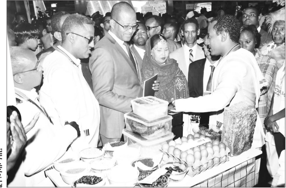
ቴት-ገበየ 23 ቀን 2016 ዓ.ም ሰንገራዊ ክፍተ ሆና ይቆያል

የእንስሳት ሃብት ሃገሮች የተሻለ ገበያ እንዲያመቻቹ ጥረት እንደሚያደርግ ይጠቅሳሉ። በተለይም በዓረብ ሃገራት ከፍተኛ የእንስሳት ሃብት ፍላጎት ስለሌለው ሀገራት እንዲነግዱ የሚደረግ መሆኑን ይጠቁማሉ። ከዚህ ጎን ለጎንም እንደመንገድ ያሉ መሠረተ ልማቶች ሃገራቱ በጋራ ተቀናጅተው እንዲያለሙ በማድረግ ማግባቻ ለመጠቀም ሆኖ እንዲሆን፣ ንግዱም እንዲሳለጥ እየተሠራ መሆኑን ያስረዳሉ።