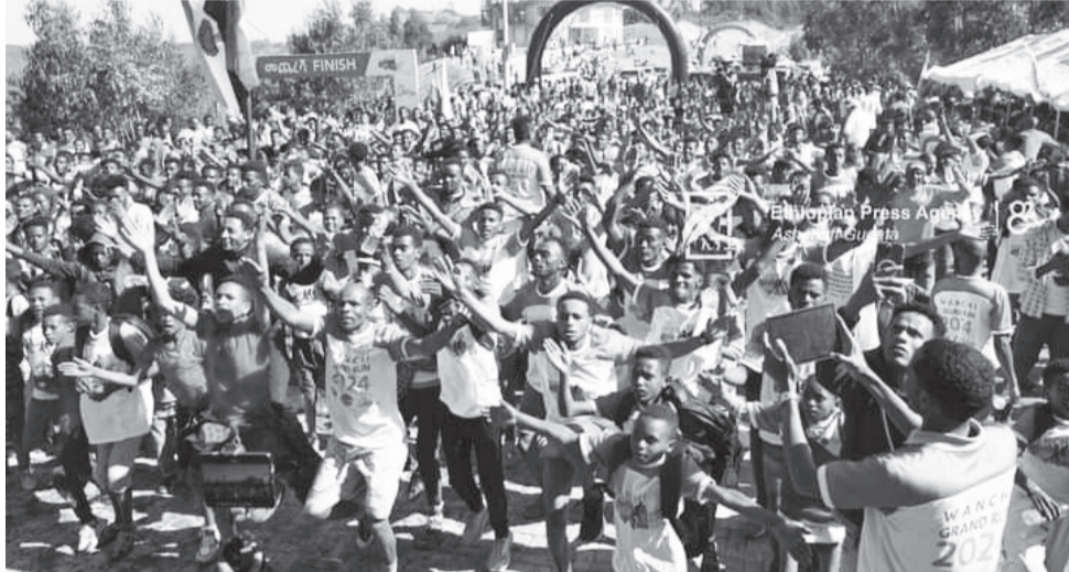
የወንጌ ደንዲ ኢኮ ቱሪዝም በቀጣይ በየዓመቱ እንደሚካሄድ ተጠቁሟል።