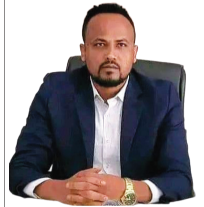
ስቶ ሴይድ ከደር