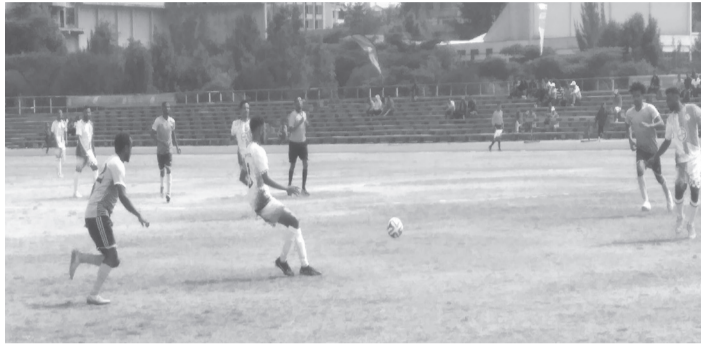
በእግር ኳስ የመክፈቻ ጨዋታ አዲስ ስበበ ውሃና ፍሳሽ መከላከያ ኮንስትራክሽንን 2016 ስነስርዓት።

ኢሠማኮ አሰሪና ሠራተኞችን ለማግባባት፣ የልማት ተቋማትን ገፅታ ለመገንባትና የሠራተኞችን አንድነት ለማጠናከር ያለውን ከፍተኛ ጠቀሜታ ስለሚገነዘብም ውድድሮችን ለበርካታ ዓመታት እያከናወነ እንደሚገኝ ገልጸዋል።