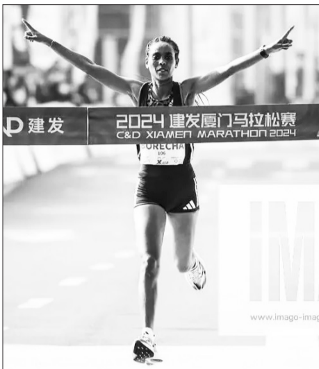
በዚህ ማራቶን ሴቶች አሸናፊ የሆነው ስፖርትስቶች አሸናፊ ሲሆኑ

በሳምንቱ መጨረሻ ከተካሄዱ የማራቶን ውድድሮች መካከል አንዱ የዱባይ ማራቶን ነው። ለዓመታት የዱባይ ማራቶንን በበላይነት ማጠናቀቅ የቻሉት ኢትዮጵያዊያን አትሌቶች ደግሞ ዘንድርም እንደተለመደው ተከታታይ በመግባት በአሸናፊነት መሬታቸው ችለዋል። በውድድሩ ታሪክ የላቀ የማሸነፍ ልምድ ያላቸው ኢትዮጵያዊያን አትሌቶች አይበገገዙት በሁለቱም ጾታ የተረጋገጠ ሲሆን፤ በተለይ በሴቶች በኩል የታወቀው ከብሪታንያ በመሰበሩ በሁለቱም ጾታዎች የፈጣን ሰዓት ባለቤቶች ኢትዮጵያዊያን ሆነው