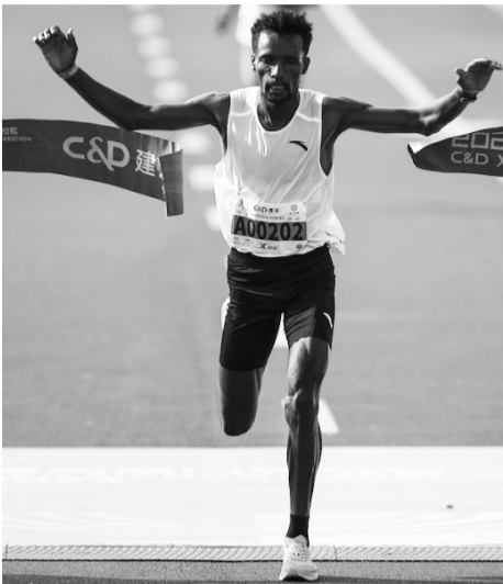
በዚህ ማራቶን ወንዶች አሸናፊ የሆነው ስፖርትስቶች አሸናፊ ሲሆኑ

በአዲሱ የኢትዮጵያ የውድድር ዓመት የመጀመሪያ ሳምንት በመላው ዓለም በርካታ የጎዳና ላይ ሩጫዎች ተከናውነዋል። በተለያዩ ርቀቶች በተደረጉት በእነዚህ ውድድሮች ላይም እንደተለመደው በርካታ ኢትዮጵያዊያን አትሌቶች ተከናውኖ ውጤታማ መሆን ችለዋል። ከእነዚህ መካከል አንዱ የቻይናው የዚመን ማራቶን ሲሆን፤ በሁለቱም ጾታዎች አሸናፊ በመሆን ውጤታማ ጅግናን አስመዘገቡዋል።