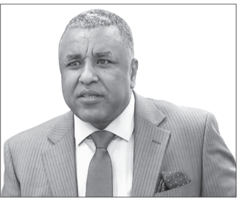
ገርማ አመንቴ (ዶ/ር)

አዲስ አበባ፡- በዓለም አቀፍም ሆነ በሀገር አቀፍ ደረጃ የሚስተዋለውን የዋጋ ግሽበት ለመቋቋም እንደ ኅብረት ሥራ ማሳበራት ያሉ ተቋማትን ተወዳዳሪና ተፅዕኖ ፈጣሪ ማድረግ እንደሚገባ ተገለጸ። የኅብረት ሥራ ማሳበራት የልማትና አድጎት የሪፎርም ንቅናቄ ተካሂዷል። በመድረኩ የግብርና ሚኒስትር ግርማ አመንቴ (ዶ/ር) ባስተላለፉት መልዕክት፤ ኢትዮጵያ ሁሉን አቀፍ ብልጽግና ለማምጣት እየተከተለች ካለው የልማት ፖሊሲ አንጻር በዓለም አቀፍም ሆነ በሀገር አቀፍ ደረጃ የሚስተዋለውን የዋጋ ግሽበት መቋቋም የሚቻለው እንደ ኅብረት ሥራ ማሳበራት ያሉ ተቋማትን ተወዳዳሪና ተፅዕኖ ፈጣሪ ማድረግ ሲቻል ነው ብለዋል። ኅብረት ሥራ ማሳበራት የዜጎችን የተናጠል ጉልበት፣ ገንዘብና እውቀት የሚያስባብሱ ናቸው ያሉት ሚኒስትሩ፤ በመንግሥት የኢኮኖሚ ዘርፍ መካከል የሚፈጠረውን ጉድለት ለመሙላትና የገበያ ሚዛን ለመጠበቅ ከፍተኛ ሚና እንዳላቸው ጠቁመዋል። በዚህም እንደ ሦስተኛ የኢኮኖሚ ዘርፍ ተደርገው የሚወሰዱ ተቋማት መሆናቸውን ገልጸዋል። በተለይም ኅብረት ሥራ ማሳበራት የምግብ ዋስትናን ለማረጋገጥ፣ ለውጪ ምንዛሪና ለኢንዱስትሪ ጥሬ እቃ ዋና ምንጭ በመሆን የሚያገለግሉትን የግብርና ክፍል ኢኮኖሚ ለማሳደግ የማይተካ ሚና ያላቸው መሆናቸውንም ጠቁመዋል። ሚኒስትሩ እንዳሉት፤ ማሳበራቱ በግብርና፣ ኢንዱስትሪና አገልግሎት ዘርፎች በመሰማራት የግብርና ግብዓት በማሰራጨትና ምርትና ምርታማነት በማሳደግ፤