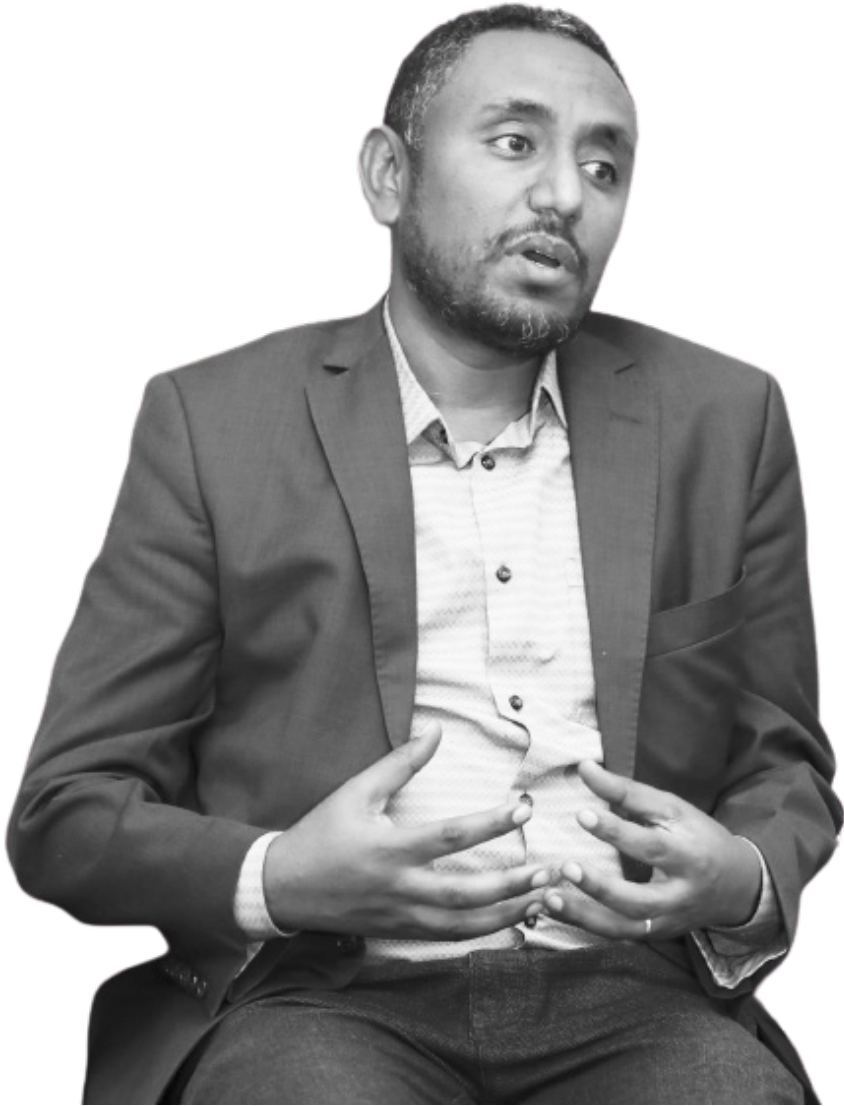
ፎቶ፡- ሐዲስ አበባ

ምክንያቱም ይህ ምክክር አሳታፊና አካታች መሆን አለበት ስንል መጨረሻ ላይ በአንድ አዳራሽ ተሰባስበው የአጅንዳ ሃሳቦችን በሚሰጡ ወይም ደግሞ በምክክር