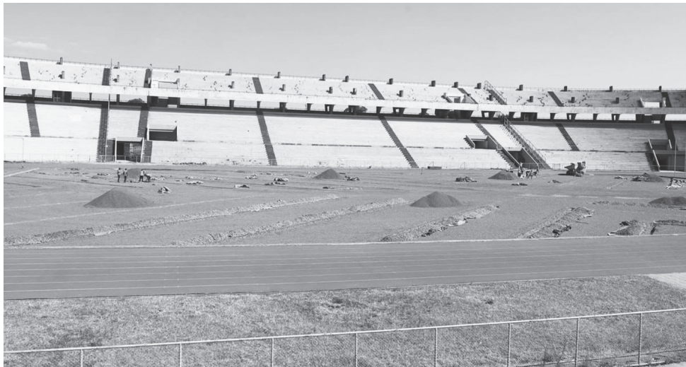
የባሕርዳር ስታዲየም የመጨመር ሚዳና የፍሳሽ መስመር በአዲስ መስክ በመገንባት ላይ ይገኛል።

የኢትዮጵያ ወንዶች ብሔራዊ የእግር ኳስ ቡድን አካል ከ2014 አንስቶ የትኛውንም አህጉር እና ዓለም አቀፍ ውድድሮችን በሜዳው እንዳያስተናግድ መታገዱ ይታወቃል። ቡድኑ ጨዋታዎችን ከሚያደርግባቸው ስታዲየሞች መካከል አንዱ የሆነው የባሕርዳር ስታዲየምም ይኸው ዕጣ ደርሶት ከዓለም አቀፍ ውድድሮች ርቆ ቆይቷል። በቅርቡ ግን የአማራ ክልል መንግሥት ስታዲየሙ አስፈላጊውን መስፈርት አሟልቶ በተቻለ ፍጥነት ይጠናቀቅ ዘንድ ተጨማሪ በጀት በማጠናቀቅ የተለያዩ ሥራዎችን ማከናወን ጀምሯል። ይህንንም ተከትሎ የኢትዮጵያ እግር ኳስ ፌዴሬሽን በባለሙያዎቹ አማካይነት በተለያዩ ጊዜያት ምልክታዎችን ሲያከናውን የቆየ ሲሆን፤ ሂደቱ በምን ደረጃ ላይ እንደሚገኝም ይፋ አድርጓል።