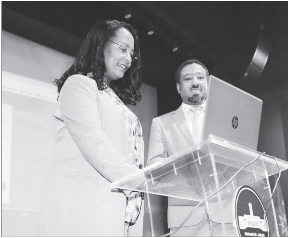
የሚያስችለው ይህ መተግበሪያ፤ በ20 የመንግሥት ብለዋል ከንቲባዋ። በተቀሩት የከተማ አስተዳደሩ ተቋማት ላይም

የመንግሥትና የህዝብ ሀብትን በሥርዓት ለማስተዳደር፣ በክነትን እና ብልሹ አሠራርን ለማስቀረት እንዲሁም ሕንፃዎችን በመመዘገብ በትክክል አውቆ ለማስተዳደርና ለመጠቀም