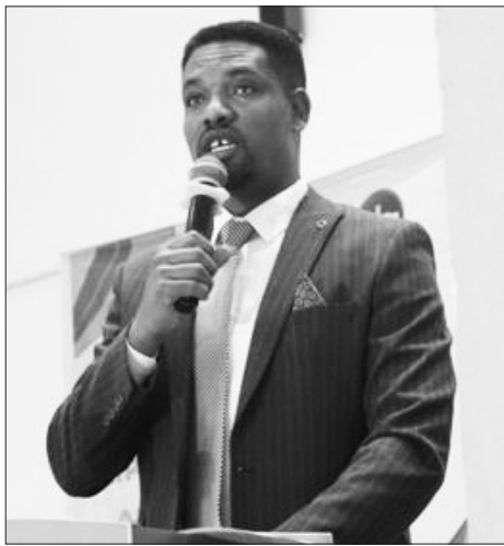
ደሳለኝ ጸጉር (ዶ/ር)