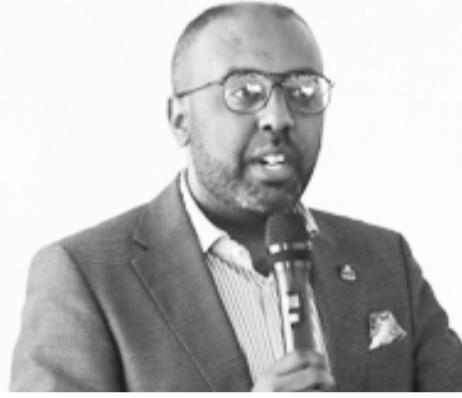
የፌዴራል የመጀመሪያ ደረጃ ፍርድ ቤት ፕሬዚዳንት ፉክሮ ኪያር