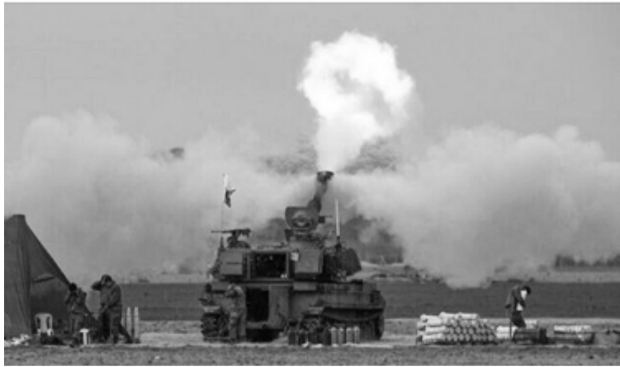
ኮንግረንሱን ሳይቆይ 45 ሺህ የታንክ ተተካሾችን ለአስራኤል ለመሸጥ መወሰኑ ይታወቃል። ይህም ሀገሪቱ አስራኤል በጋዛ በንጹሐን

ላይ የምትፈጸመውን ድብደባ እንድትቀንስ ከምታደርገው ጫና ጋር የሚቃረን ነው በሚል ተቃውሞ ሲነሳበት ይደመጣል።