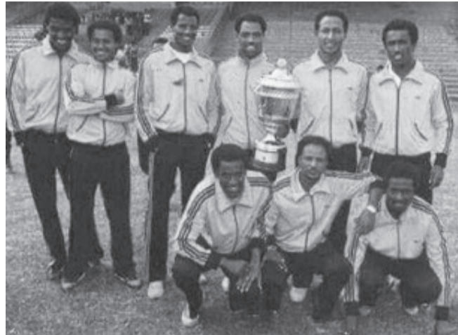
ኢትዮጵያ ከአፍሪካ ዋንጫ በኋላ ያገኘችው ታሪካዊ የሴካፋ ድል 36 ዓመት ሞላው።

በውድድሩ ድባብ እና ጨዋታውን በቴሌቪዥን ሲያስተላልፍ የነበረው ደምሴ ዳምጤ የሚታወቁ ገለፃዎች አሁንም ድረስ ከኢትዮጵያውያን አዕምሮ ስላልወጣው ውድድር የወቅቱ የቡድኑ አምበል የነበረው እና ወሳኛን የፍጻሜ ግብ ያስቆጠረው እንዲሁም ውድድሩን በተጫዋቾች እና ኋላ ላይ ደግሞ በረዳት አሰልጣኝነት