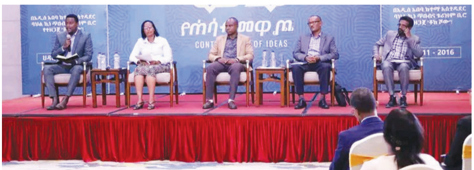
«የሥራ ባህልና የግል ኃላፊነት» በሚል ርዕስ 12ኛው ዙር የሃሳብ መዋወቅ ግዳር 11 ቀን 2016 ዓ.ም በስኳይ ላይት ሆተል ተካሂዷል

ማኅበረሰቡ ለየት ባለ መልኩ የታወቁ እኩልነትን በተግባር ያሳየ፣ ሥራን «ማኅበረሰብ እምነት» ያደረገም ነው። ማኅበረሰቡ ልማዳዊና ባህላዊ ክንዋኔዎችን ለሀገር በሚጠቅም አግባብ በማሻሻልና አዳዲስ እሴቶችን በማስተዋወቅ ልምድ የሚቀመርበት ተቋም ሆኖ እያገለገለ ይገኛል። በተለይ የሥራ ፍቅር፣ ታሪካዊ፣ የጊዜ አጠቃቀም፣ በወንዶችና በሴቶች መካከል ድንበር የሌለው የሥራ መስተጋብር የአውራጃዎች ማኅበረሰብ እንቅ እሴቶቹ ናቸው። በሥራ ባህል ባሳየው ተምሳሌታዊነት የበርካታ ግለሰቦችን፣ ቡድኖችን፣ መንግሥታዊና መንግሥታዊ ያልሆኑ ተቋማትን ቀልብ በመሰብ የቱሪዝም መስህብ ሆኖ እየተገኘ ይገኛል። ጠንካራ የሥራ ባህልና ከአድሎ የፀዳ አሥራን በመተባበር የሚፈለገውን ውጤት ማምጣት