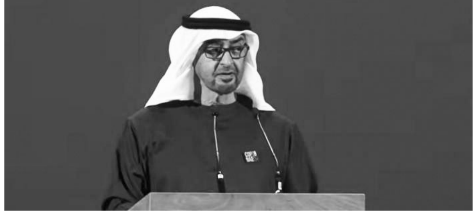
መካሄድ የጀመረ ሲሆን፤ እስከ ነገ ይቀጥላል። በዚህ የመሪዎች ጉባዔ ላይ የ137 ሀገራት እና መንግሥታት መሪዎች ግግር እንደሚደረጉም የወጣው መርሃ ግብር ያመለክታል ሲል የዘገበው አል ዓይን ነው።

መጠቅሚ ላይ ትኩረት እንደምታደርግም ፕሬዚዳንቱ አስታውቀዋል። በዚህ ወቅትም ሼክ ሞሃመድ ቢን ዛይድ አረብ ኢምሬትስ በቀጣይ 7 ዓመታት ውስጥ ለአየር ንብረት ለውጥ ርምጃ ቢታዳሽ እና ንጹህ የኃይል ምንጭ ዘርፍ ተጨማሪ 130 ቢሊዮን ዶላር ኢንቨስት እንደምታደርግም አስታውቀዋል። የተመድ ዋና ፀሐፊው በኮፕ28 ጉባዔ ባደረጉት ግግር፣ የአየር ንብረት ለውጥ ከአንታርቲካ እስከ ኔፓል ጉልህ ተጽዕኖውን እያሳየ እንደሚገኝ ተናግረዋል። “ከፍተኛው የዓለም የመቀት መጠን በዚህ ዓመት ተመዝግቧል፤ ወደ ከባቢ አየር የተለቀቀው ካርቦንም ከፍተኛው ነው፤ ድርቅና ጎርፉም እየተባባሰ ሄዷል” ያሉት አንቶኒዮ ጉቴሬዝ፣ በፓሪስ የተደረሰውን ስምምነት መፈጸም አለመቻሉ ፈተናውን እያከበደው መሄዱን አብራርተዋል። በመሪዎች ደረጃ የሚካሄደው 28ኛው የተባበሩት መንግሥታት ድርጅት የአየር ንብረት ለውጥ ጉባዔ ዛሬ