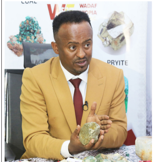
በማዕድን ልማት እየተጋ ያለው ዋዳጅ ሺትዮጵያ