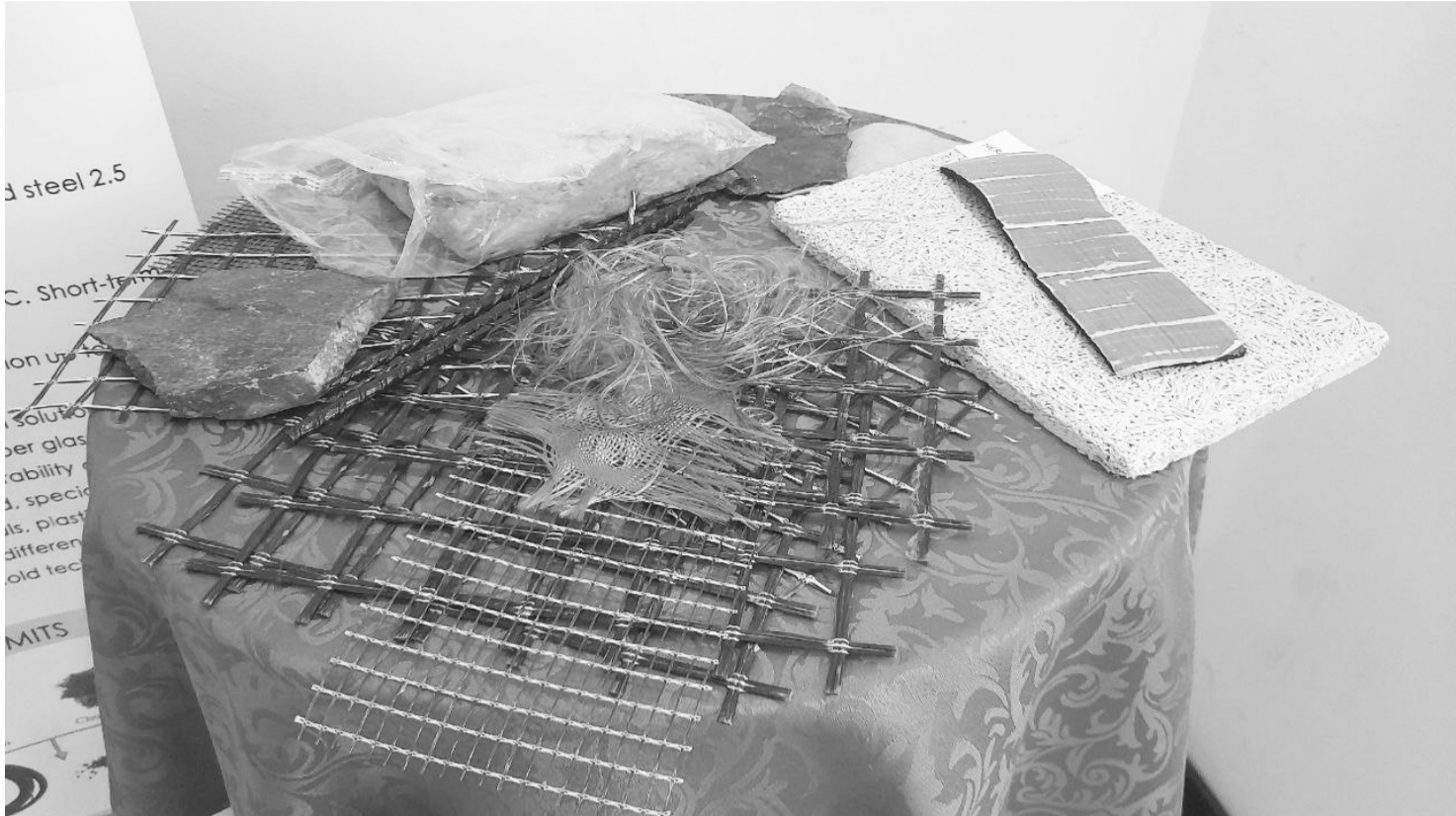
ስኮንስትራክሽን ግብዓት የሚውሉ የባዛልት ወይም ጥቁር ድንጋይ ናሙናዎች

እንደ አቶ ነብዩ ማብራሪያ፣ ከዚህ ቀደም የጥቁር ድንጋይ ቴክኖሎጂ በመጠቀም በቻይና፣ ደቡብ ኮሪያ፣ ካዛኪስታን፣ ዩክሬን፣ ኡዛቤክስታን ሀገራት ጥቅም ላይ የዋለ ነው። እንዲሁም እንደ BMW፣ ሾልትስ ስፍራ መኪና አምራች ካምፓኒዎችም ለኤሌክትሪክ መኪና ምርት ቀላልና ጠንካራ በመሆኑና የባትሪያቸውን እድሜ ለመጨመር የሚገለገሉበት መሆኑንም አመለክተዋል። የኮንስትራክሽን ዘርፉ በርካታ ወጪዎች ያሉበት እና በሚሊዮን የሚቆጠሩ የውጭ ምንዛሪዎችን ከሀገር ውስጥ የሚያስወጣ ነው። በመሆኑም ይህንን ችግር ለመቅረፍ የኮንስትራክሽን ግብዓቶችን አሟጦ መጠቀም እና በሀገር ውስጥ ምርቶች መተካት ይገባል። በሀገር ውስጥ መተካት