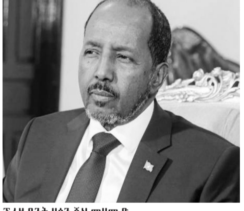
ፕሬዚዳንት ሀሰን ሼህ መሀመድ

የተመድ የጸጥታው ም/ቤት በሶማሊያ ላይ የጣሰውን ስ30 ዓመታት የዘለቀውን ማዕቀብ ለማንሳት ድምጽ ሊሰጥ ነው። የተመድ የጸጥታው ምክር ቤት ለሶማሊያ መንግሥት እና የጸጥታ ኃይሎች የጦር መሳሪያ እንዳይሰጥ የሚከለክለውን ማዕቀብ ለማንሳት ድምጽ እንደሚሰጥ ሮይተርስ ዘግቧል። የጸጥታው ም/ቤት በፈረንጅቹ 1992 በሶማሊያ ላይ የጦር መሳሪያ ማዕቀብ የጣለው፣ የሀገሪቱን መሪ መሀመድ ሲያድ ባሬን ያስወገዱት ተቀናቃኝ ታጣቂዎች መሳሪያ እንዳይደርሳቸው ለማድረግ ነበር።