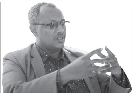
ሐፍታዊ ገዢዎች ስብሰባ