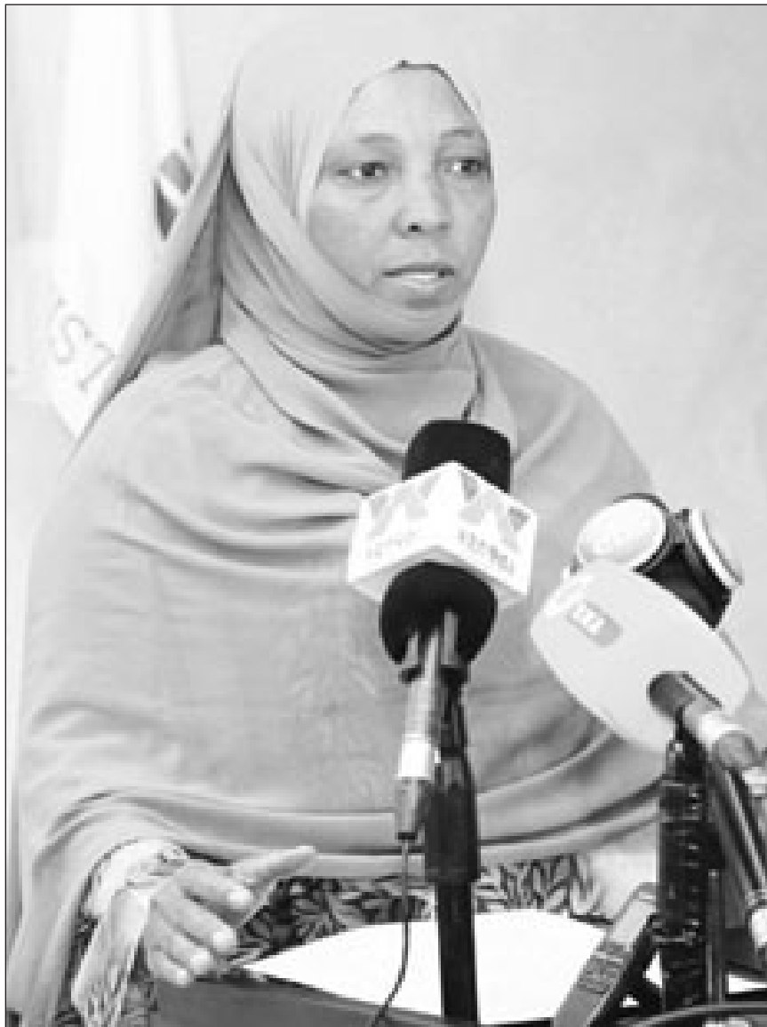
የግብርና ሚኒስቴር ሚኒስትር ዴኤታ ሶፊያ ካሳ (ዶክተር)

እንደ ሚኒስትር ዴኤታዎ ገለጻ፣ ባለፈው ዓመት ለትግራይ ክልል የተገዛውን የአፈር ማዳበሪያ ሳይጨመር 12 ነጥብ ስምንት ሚሊዮን ኩንታል ተገዝቷል። ከዚህ የዘንድሮው አንጻር ከፍተኛ ጭማሪ አለው። በዚህ ደግሞ የምርት ዘመኑን ኢትዮጵያ በታሪኳ ከፍተኛ የሆነ የማዳበሪያ ግዥ የፈጸመችበት ያደርገዋል። ከዚያም ባሻገር ይህ የምርት ዘመን የአፈር ማዳበሪያውን ፈጥኖ