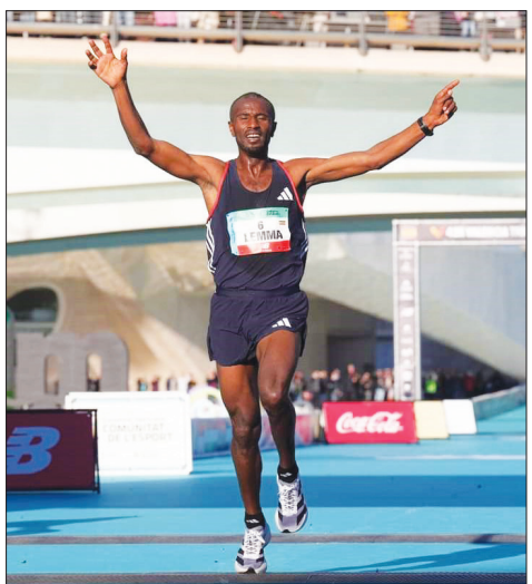
አትሌት ሲሳይ ሰማ።

የዓለማችን ሦስተኛው ፈጣን የማራቶን ሰዓትን በ2:01:41 በበርሊን 2019 ማራቶን የጨበጠው ቀንኒሳ በቀጣዩ የፓሪስ አሊምፒክ ላይ ለአራተኛ ጊዜ ሀገሩን ለመወከል ትልቅ ጉጉት