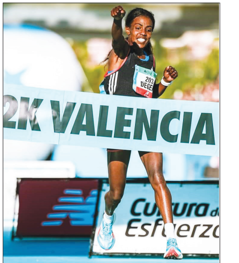
አትሌት ወርቅነሽ ደገፋ።

ጀግናው አትሌት ከውድድሩ ቀደም ብሎ "ከዚህ ቀደም በትራክ እና በሀገር አቋራጭ ውድድሮች ላይ የተቀዳጃቸውን ታላላቅ ድሎች በነፃ ላይ ውድድሮች መደገም አልቻልኩኝም። በማራቶንም የአቅሚን ያህል ስኬታማ ነኝ ብዬ አላስብም። ለረጅም ጊዜያት ከጉዳት ጋር ስታገል ቆይቻለሁ። ጠንካራ ልምዶቼን ስሰራ ቆይቻለሁ፤ ነገር ግን ልምዶቼን በጥሩ መንገድ ጨርሼ