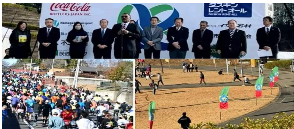
በአበበ ቢቁላ መታሰቢያ ውድድር ከ1600 በላይ ሯጮች ተሳትፈዋል።

ተሳትፈዋል። በጃፓን የአፌራዎ አምባሳደር ዳባ ደበሌ የግማሽ ማራቶን ውድድሩን ያስጀመሩ ሲሆን፣ መሰል ወድድሮች ረጅም ዘመናት ያስቆጠረውን የሁለቱን ሀገራት መልካም ግንኙነት እንዲሁም የሕዝብ ለሕዝብ ግንኙነቱን ይበልጥ አጠናክሮና አስተሳሰሮ ለማስቀጠል ሚናው የጎላ መሆኑን ገልፀዋል። የጃፓን መንግሥት ይህን ውድድር በማዘጋጀቱና የጀግናው አትሌት አበበ ቢቁላ መታሰቢያ በማድረጉም ምስጋና አቅርበዋል። የካሳማ ከተማ ከንቲባ ሺንጃ ያማጉቺ በበኩላቸው፣ የከተማው አስተዳደር ከኢትዮጵያ ኤምባሲ ጋር እየሰራ ያለውን ሥራ አጠናክሮ እንደሚቀጥል ገልጸዋል። በቀጣይ ከከተማዋ አስተዳደር የተውጣጣ ልዑክ በመምራት ኢትዮጵያን እንደሚጎበኙና ከኢትዮጵያ ከተሞች ጋር ግንኙነት በመመስረት በትብብር መሥራት እንደሚፈልጉ መግለጻቸውን በጃፓን የኢትዮጵያ ኤምባሲ መረጃ አመልክቷል። 650 አትሌቶችን በማሳተፍ የተጀመረው ይህ ውድድር ከዓመት ወደ ዓመት የተሳታፊዎቹን ቁጥር እያሳደገና እውቅናውም እየጨመረ ይገኛል። በጃፓን በሚካሄዱ የተለያዩ የማራቶን ውድድሮች ማሸነፍ የቻሉ እንደ አበበ መኮንን አይነት አትሌቶችም ባለፉት ዓመታት በውድድሩ ላይ በተጋባዥነት ተገኝተው ሲያስጀምሩ እንደነበር ይታወቃል። ውድድሩ በሚካሄድበት ወቅት የጃፓን ከተማ ካሳማ ነዋሪዎችና ባለሥልጣናት እንዲሁም በጃፓን የሚኖሩ ኢትዮጵያውያን የሚታደሙ ሲሆን የኢትዮጵያ ባህላዊ የቡና