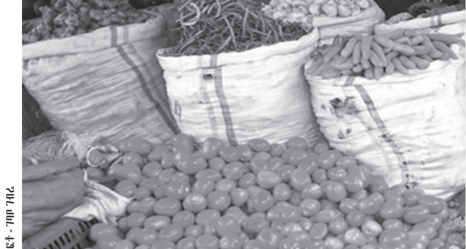
ፎቶ - ገበያ ገዢ

ለምርት አቅርቦት ችግር እንደ ምክንያት የሚነሳው አቅራቢዎች ለደላላ ሁለትና ሶስት ቦታ እንደሚከፍሉ እና መንገድ ላይ የሚያጋጥሙ ችግሮች እንዳሉ የጠቀሱት አቶ ሸመልስ፣ የአቅርቦት ችግር መኖሩ እና የዋጋ ጭማሪው የአትክልት ገበያው እንዲቆጣጠር እድርጓል ሲሉ ተናግረዋል።