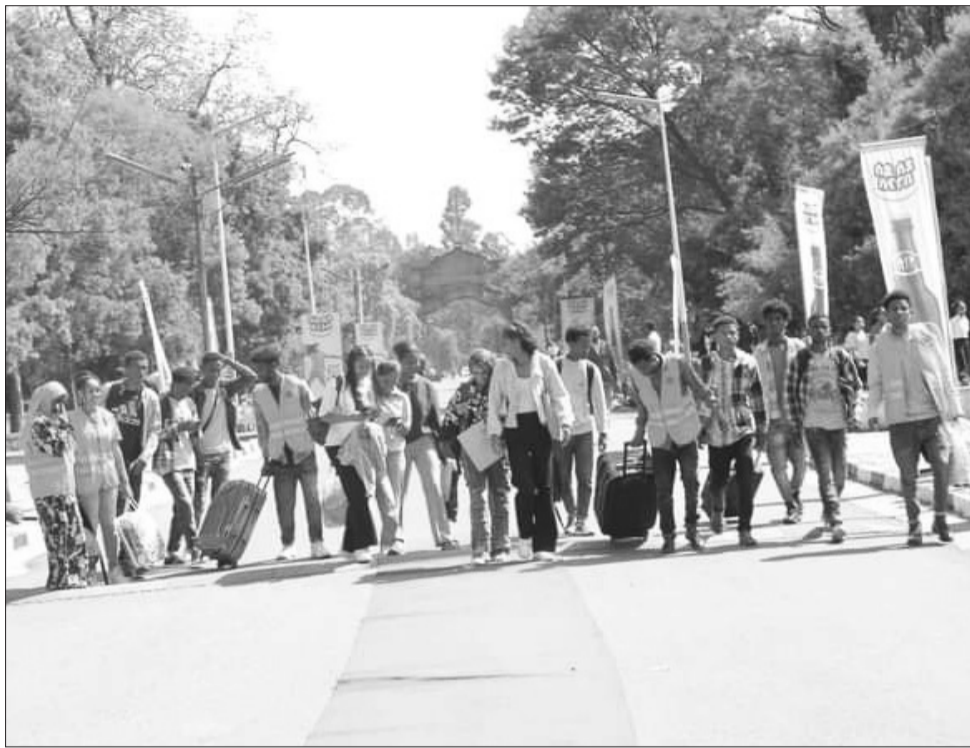
የአዲስ አበባ ዩኒቨርሲቲ ሰዎችን አቀባበል ደደረገላቸው አዲስ አበባ ተማሪዎች በከፈል።

ሌሎቹስ? አሁን፤ ለ2016 ዓ.ም የትምህርት ዘመን የማለፊያ (መቆሪያ) ነጥብ በማምጣት በትምህርት ሚኒስቴር የተመደቡለትን 832 አዲስ ገቢ ተማሪዎች ተቀብሎ የመዘገበውን አዲራት ዩኒቨርሲቲ ጠቅሰን፤ በሀገሪቱ ከሚገኙ 15 የአፕላይድ ሳይንስ ዩኒቨርሲቲዎች አንዱ የሆነው ዲላ ዩኒቨርሲቲም በተመሳሳይ ምዝገባና ቅጠላን አጠናቅቆ ወደ ተግባር መግባቱን አመልክተን፤ አሰልፈናል። የመገባቱ ለምሳሌ ይህ የመገባቱ ለምሳሌ አገልግሎቶች በማሟላት ለዚሁ ዓመት (የትምህርት ዘመን)