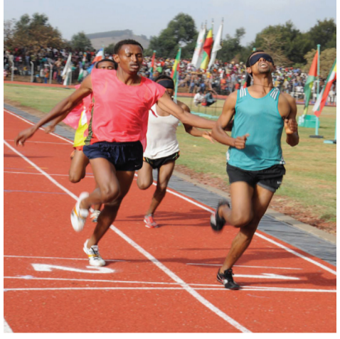
በወጣቶች ስፖርት አካዳሚ በተካሄደው የማጣሪያ ውድድር በተለያዩ የጉዳት ዓይነቶች አትሌቶች ተሰይደዋል።

ዓለም አቀፍ ውድድሩ ዲባይ 4ኛ በምትባል ከተማ የካቲት ወር መጀመሪያ የሚካሄድ ሲሆን ግራንድ ፕሪ (Grand prix) ይባላል። ይህም የፓራሊምፒክ ተግባራትን ለማስታወቅ የሚያስችላቸውን ሚኒማ