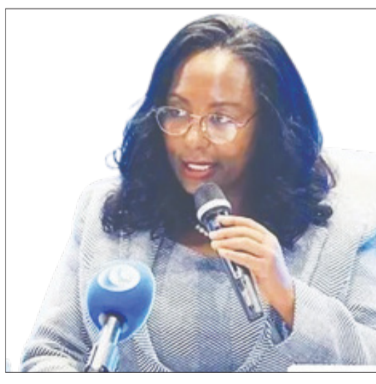
ከንቲባ አዳኝ አቤቤ