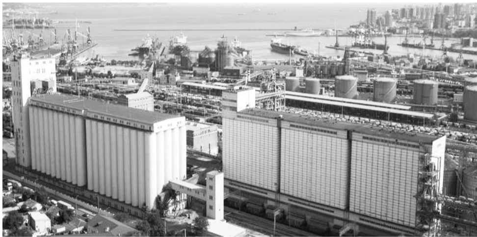
ከኖቮሮሲይስክ የሰንደ ማከማቻ ማዕከል ከፍተኛ የሰንደ ምርት ስተሰደዩ ሀገራት ይሰራጫል

በመንገድ ዳር የሚገኙ ነዳጅ ማደያዎች ደግሞ ባለቤት አልባ እስኪመስሉ ድረስ ዩኒፎርም የለበሱ ሰዎች አይታዩባቸውም። ምክንያቱ ደግሞ ማንም ነዳጅ መቆያት የፈለገ አሽከርካሪ የገንዘብ ካርዱን አውጥቶ የሚፈልገውን ያክል ከቀዳ በኋላ በአራሱ ክፍሉ የሚሄድበት አሠራር በመተግበሩ ነው።