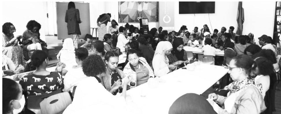
በክር የሚሰራ የእጅ ሥራ አልባሳት ተፈላጊነት እየጨመረ ነው

ችሎታ በተለያዩ ጊዜ ብታዳብረውም ወደ ገበያ ለማቅረብ ግን ሃሳቡ አልነበራትም። ትምህርቷን ያጠናቀቀችው በማርኬቲንግ ሲሆን ተቀጥሎ በምትሰራባቸው ቦታዎች ላይ በትርፍ ጊዜዋ እነዚህን የክር አልባሳት ትሰራለች። ይህንን የተመለከቱ ወደ ቢሮዋ የሚመጡ ሰዎችም ሥራዋን ሙያዎቿ ይጀምራሉ፤ ይህ ብቻም ሳይሆን እንደትሰራላቸው ጥያቄ ያቀርቡላት ጀመረ። ያን ጊዜ ነው የተለያዩ ትዕዛዞችንም ተቀብላ መሥራት የጀመረችው።