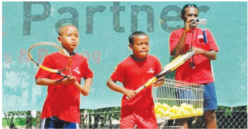
ውድድሩ ስታዳጊ ኢትዮጵያውያን የዓለም አቀፍ ውድድር አደጋ ይፈጥራል።

በኢትዮጵያ አስተናጋጅነት እየተካሄደ በሚገኘው ዓለም አቀፍ የወጣቶች የጫዳ ቴኒስ ውድድር ኢትዮጵያውያን የቴኒስ ተወዳዳሪዎች ጥሩ እንቅስቃሴን እያደረጉ ነው። በውድድሩ ከ24 የዓለም ሀገራት የተወጣጡ ከ45 በላይ የሚሆኑ እድሜያቸው ከ13 እስከ 18 ዓመት የቴኒስ ተወዳዳሪዎች እየተሳተፉ ይገኛሉ። በሁለት ዙፋኖች የሚጠናቀቅ «ኢንተርናሽናል ጁኒየር (J-30)» አዲስ አበባ የተሰኘ የወጣቶች የጫዳ ቴኒስ ውድድርን በማስተናገድ ላይ ትገኛለች። ተመሳሳይ ውድድር በኢትዮጵያ ሲዘጋጅ በአጠቃላይ ለሦስተኛ ጊዜ ሲሆን በወጣቶች መካከል ሲዘጋጅ ደግሞ ሁለተኛው ነው። የመጀመሪያው ዙር ውድድር ከኅዳር 15 ጀምሮ በአዲስ አበባ ቴኒስ ክለብ የተካሄደ ሲሆን ከቀናት በፊት ተጠናቋል። ሁለተኛው ዙር ውድድርም እየተካሄደ የሚገኝ ሲሆን ኅዳር 30-2016 ዓ.ም እንደሚጠናቀቅ ለማወቅ ተችሏል። ውድድሩን የኢትዮጵያ ቴኒስ ፌዴሬሽን ከዓለም አቀፍ ቴኒስ ፌዴሬሽን የተሰጠውን እድል ተጠቅሞ ከአዲስ አበባ ቴኒስ ክለብ ጋር በመተባበር ማዘጋጀቱም ተጠቅሟል።