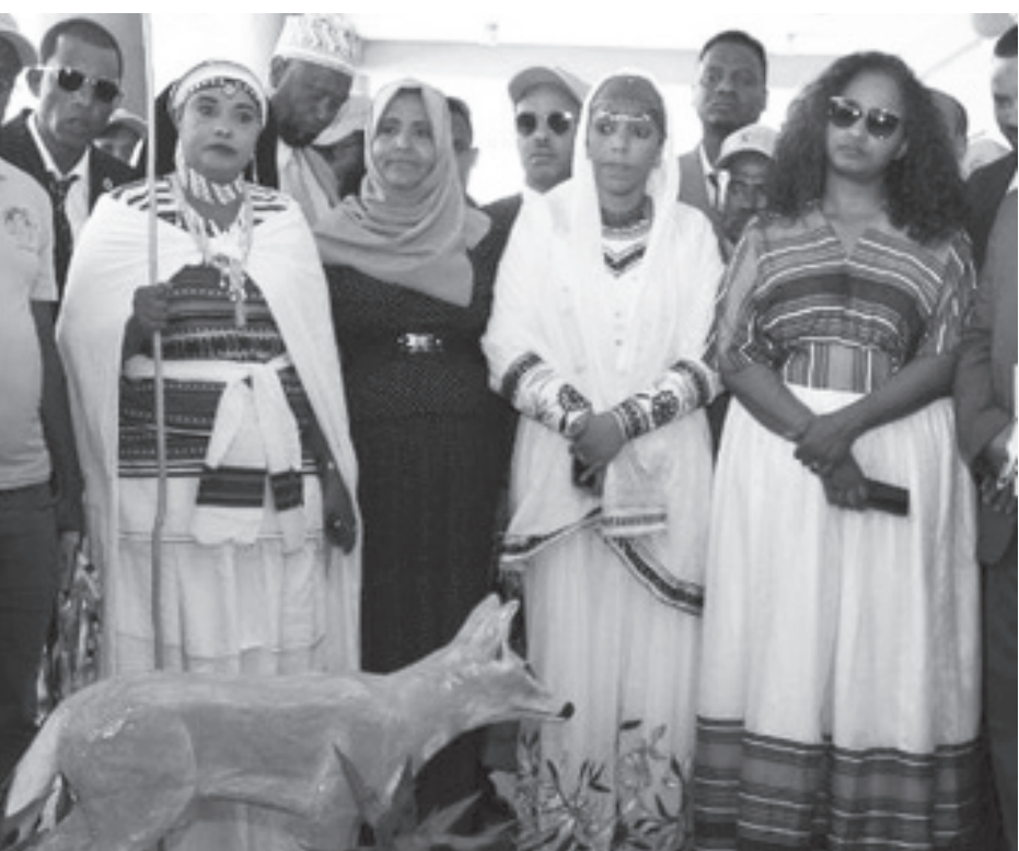
በዕለቱ የተዘጋጀው የቱሪዝምና ባህላዊ ኢንዱስትሪ ተገብቷል

መንግሥት ፓርኩን ይጠልጥ ስኬታማ ለማድረግ መሠረተ ልማት ግንባታ ሥራዎችን ጨምሮ አምስት