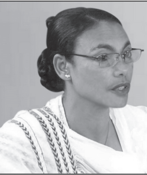
የአዲስ አበባ ከተማ ከንቲባ አዳነች አቤቤ