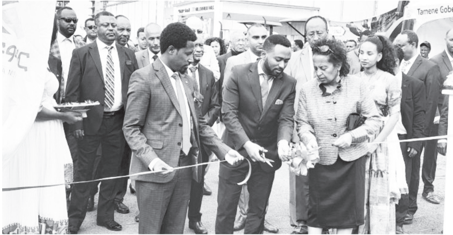
የንግድ ትርጉም በተከፈተበት ወቅት

በዓለም አቀፍ የንግድ ትርጉም ተሳታፊ በመሆን የተለያዩ ጠቀሜታዎችን አግኝቷል የሚለው ሌላኛው ተሳታፊ ያሳርት ኢንጅነሪንግ ኃላፊነቱ የተወሰነ የግል ድርጅት ነው። ድርጅቱ ላለፉት 18 ዓመታት በኤሌክትሮኒክስና ኢንፎርሜሽን ቴክኖሎጂ ስጦታ ስጦታ በዘርፉ በጎ ተጽዕኖ