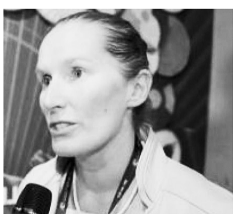
ዓለም ባንክ የአየር ንብረት ለውጥን ለመቀነስ ሥራዎች የሚያቀርበውን ብድር ወደ 9 ቢሊዮን ዶላር ከፍ ለማድረግ ቃል ገብቷል

ዓለም ባንክም ተፈጥሮን መጠበቅ ለመሠረተ ልማት ማስፋፋትም ሆነ ዘላቂ