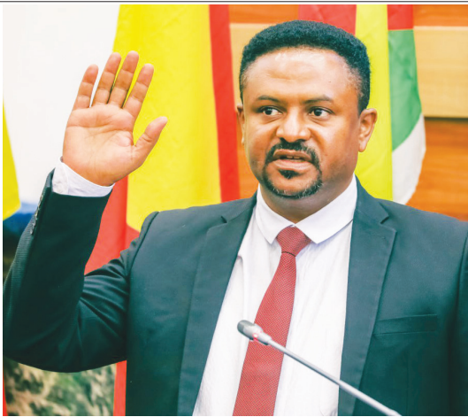
ከተ ገነኝት ጋይሱ