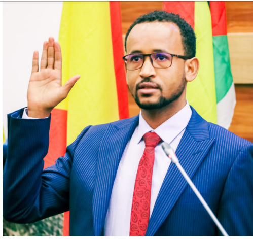
ከተ ሚኒስትር ተፈሪ