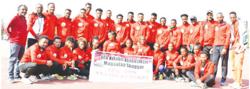
የሸገር ከተማ አትሌቲክስ ክለብ 60 አትሌቶችን አቅፎ በቅርቡ ሸገር አቀፍ ውድድሮች ላይ እየተሳተፈ ነው።

ክለቡ ከተመሠረተበት ወቅት ጀምሮ ዝግጅቱን በአግባቡ እያከናወነ የሚገኝ ሲሆን፣ በ2016 ዓ.ም የኢትዮጵያ አትሌቲክስ ፌዴሬሽን በሚያዘጋጃቸው ውድድሮች ለመሳተፍ እንቅስቃሴዎችን እያደረገ እንደሆነና ተፎካካሪና ውጤታማ ለመሆንም አቅዶ እየሠራ እንደሚገኝ የክለቡ ሥራ አስኪያጅ አቶ ጌቱ ሸፈራው ገልጸዋል። ለዚህም የኢትዮጵያ አትሌቲክስ