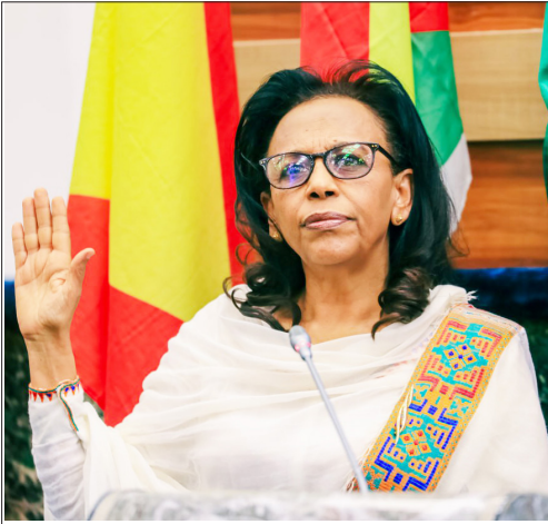
ወ/ሮ ሚኒስትር ጋይሱ