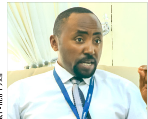
ስቶ መንግሥቱ ንጉሤ