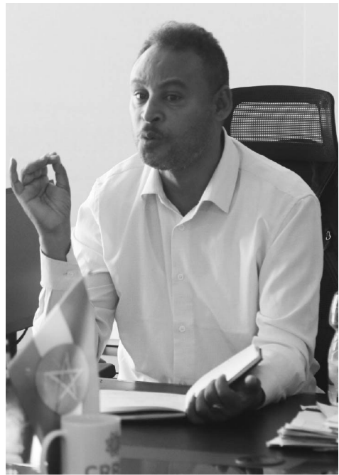
ስት ግፋወሰን ደሴሳ

በከተማዋ ካሉት 424 ሺህ በላይ የመሬት ይዞታዎች መካከል በዘመናዊ የመሬት ይዞታ ምዝገባ ሥርዓት የተከናወነባቸው ከ330 ሺህ በላይ ቁራሽ መሬቶችና