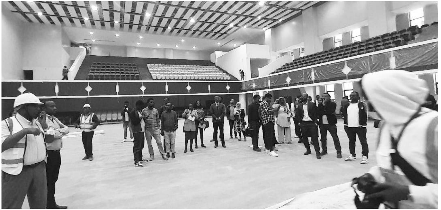
ፕሮጀክቱ ግንባታ 95 በመቶ የተጠናቀቀ ሲሆን፣ በአንድ ወር ውስጥ ሙሉ ለሙሉ እንደሚጠናቀቅ ይጠበቃል።

ጥላሁ ሁለት የሚባሉትን ያካተተ ሲሆን፣ ጥላሁ አንድ የሚባለው በተለምዶ መነፅር ቤቶች በሚባለው አካባቢ እየተገነባ የሚገኝ ነው። ከለገሃር ባቡር ጣቢያ ጀምሮ ቸርቸል ጎዳናን ይዞ ፒያሳ ድረስ ያለው ስፍራ የኢትዮጵያ የታሪክ መዘከሮች ኮረዶ መሆኑን ጠቅሰው። በዚህ ስፍራ ጥላሁ ሁለት የሚሉ ተጨማሪ መዘከር መካተቱን ጠቁመዋል። ኮረዶን ተከትሎም ዓድዋ ሙዚየም ሲደረስ ትልቁን እሴት የሚያሳይ ቦታ ይኖረናል ብለዋል።