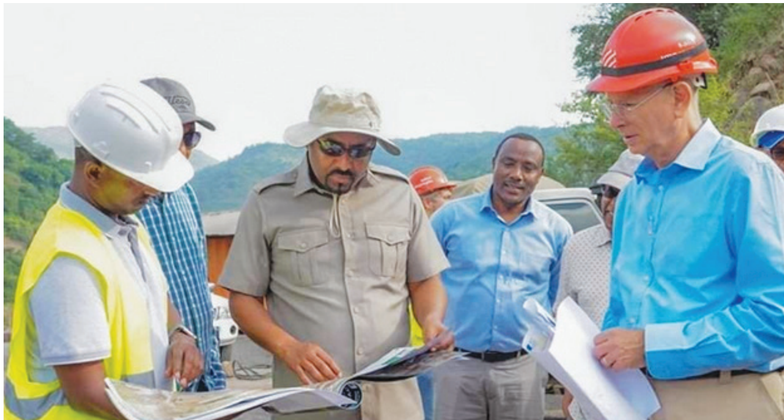
ጠቅላይ ሚኒስትር ዐቢይ አሕመድ(ዶ/ር) የፕሮጀክቱን አፈጻጸም ገምገመዋል