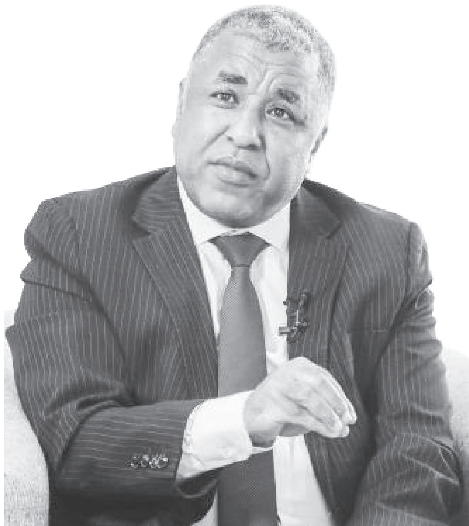
ፊ.ቶ. - በሪፖርት ታደሰ

ባለፈው አምስት ወራት ለመስራት ያቀድነው 25 ሚሊዮን ነው። ከዚህ ውስጥ አሁን 29 ነጥብ አምስት ሚሊዮን ሰርተናል። ይህ በጣም ትልቅ እድገት ነው። ከአምናው እቅድ ጋር ስናስተያይ ግማሽ ዓመት ላይ የባለፈው እቅዳችንን ልናሳካ የምንችልበት ሁኔታ እንዳለ ነው። ሁለተኛው አመላካች በተለይ ወተት ልማት