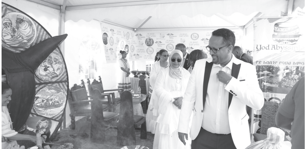
የቱሪዝም ሳምንት ስምንት ቀናት በፎቶ ጌግዚቢሽንና በተለያዩ ዝግጅቶች ተከብሯል