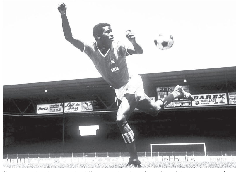
የመጀመሪያው የአፍሪካ ባሎን ደ አር አሸናፊ ሳሊፍ ኬይታ ከጥቂት ወራት በፊት ከዚህ ዓለም በሞት ተለይቷል።

ሳሊፍ ኬይታ በሀገሩ ማሊ ዲያራ እና ካኑቴ አስኪመጡ ድረስ እጅግ በጣም የተከበረና ለበርካቶች አንድ ትልቅ አርዳኝ የሚቆጠር ነበር። ገና የ16 ዓመት ታዲላ ሳለ ነው በ1963 ለማሊ ብ/ቡድን የመጀመሪያ ጨዋታውን ያደረገው። በ1972 የአፍሪካ ዋንጫ ሁለተኛ