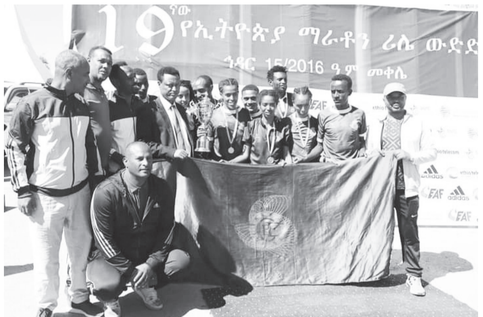
የኢትዮጵያ ንግድ ባንክ የወርቅ ሜዳሊያና የዋንጫ ተሸላሚ ሆኗል።