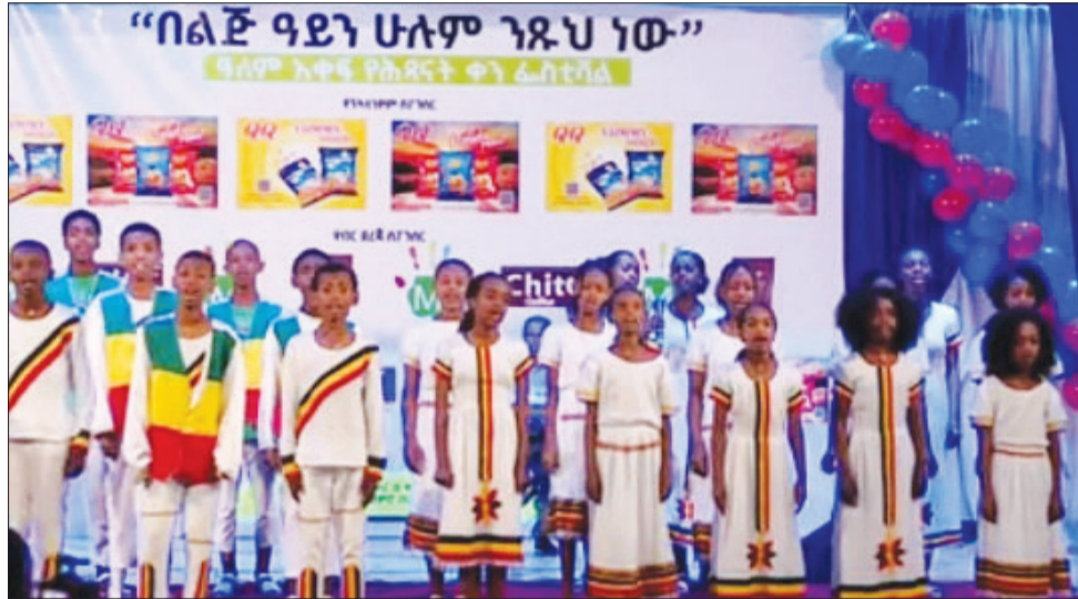
እ.ኤ.አ. ከ1990 ጀምሮ የዓለም የሕፃናት ቀን ኅዳር 11 ይከበራል።

ሰለዚህም የሕፃናትን ቀን በማስመልከት ከተደረጉት ዝግጅቶች መካከል ቅዳሜ ኅዳር 08 ቀን 2016 ዓ.ም በሀገር ፍቅር ቴአትር ቤት «በልጅ ዓይን ሁሉም ንጹህ ነው» በሚል መሪ ሃሳብ በድምቀት የተከበረው ፊልሙ አንዱ ነው። በዚህ ፊልሙ ላይ የሕፃናት መጽሐፍት ኤግዚቢሽን፣