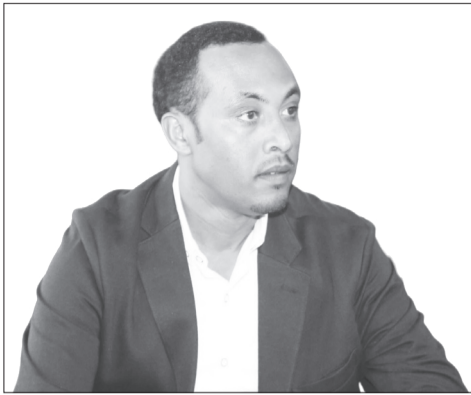
አንዲንር ሀብታሙ ተገኝ