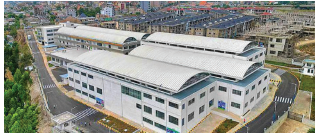
በኮልፌ ከ/ከ የተገነባው የገበያ ምርት ማከማቻና መሸጫ ማዕከል