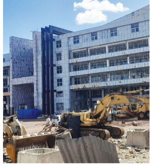
የቃሲቲ ሞዲል መናኸሪያ ግንባታ - በማጠናቀቂያ ምዕራፍ