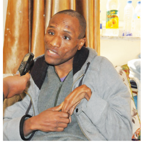
ኑርን በፈተና - ሕይወትን በፅናት