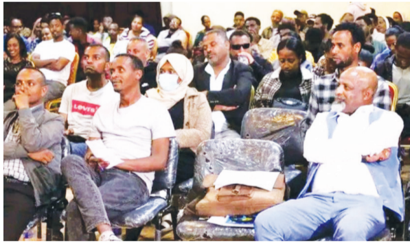
ቢሮው የሀገር ውስጥ የጎብኝት ባህልን ለማሳደግ ለዘርፉ ባለሙያዎች ሥልጠና ሰጥቷል

እንዲያስገኝ ማመቻቸት ወሳኝ ሥራ መሆኑ አንዱ ነው። አሁን ላይ ያጠረገን የውጭ ምንዛሬ ገቢን ከፍ ለማድረግም ትልቁና ሰፊው ምንጭ ይኸው ቱሪዝም መሆኑ ሳይታለም የተፈታ ነው። በተጨማሪም የሰው ኃይል በማሳማራት ረገድ ጥቂት የማይባል ሥራ ሊፈጥር የሚችል መስክ ነው። ሲሉ ኢትዮጵያውያን በሀገራቸው የሚገኙ የቱሪዝም ሀብታቸውን እንደማይውቁ እና የሀገር ውስጥ ቱሪዝም መስፋፋት ለአካባቢያዊ የኢኮኖሚ እንቅስቃሴ መጠናከር እንዲሁም የሕዝብ ለሕዝብ ትስስርን በመፍጠር ብሔራዊ አንድነትን ለማጎልበት አስተዋኦ አለው። ታዲያ ይህ በኢኮኖሚ አቅምን ለማጎልበት ቀዳሚ ተጠሪ ሊሆን የሚችል ዘርፍ ለምን እና እንዴት ተቆላጠብን? የሚል ቁጭት ያጭራል። የሀገር ውስጥ ጎብኚዎች ዝቅተኛ ከሆነባቸው ምክንያቶች መካከል የህብረተሰቡ የመጎብኘት ልምድ አነስተኛ መሆኑ፣ ለጎብኚ ትኩረት አለመስጠት፣ የፍላጎት ማሳከም እንዲሁም የፋይናንስ አጥረት በዋነኝነት ተጠቃሽ