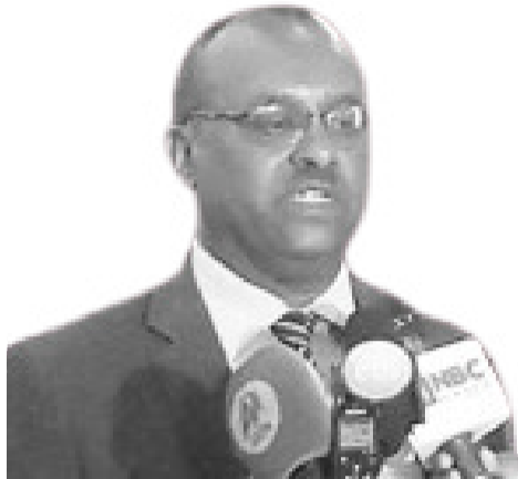
ስተ ደዳ ደረባ

በመዲናዋ አሮጌና ከፍተኛ ጭስ የሚለቁ በርካታ መኪናዎች መኖራቸውን በመጥቀስ፣ መኪናዎቹን