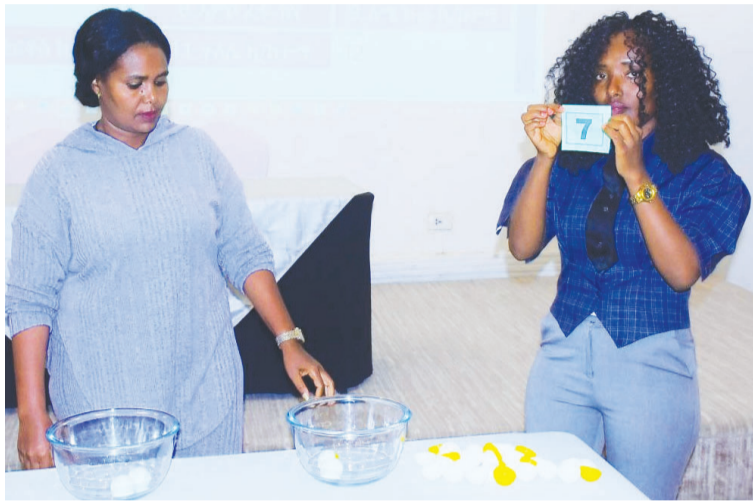
የ2016 ዓ.ም የሴቶች ፕሪሚየር ሊግና ከፍተኛ ሊግ ውድድሮች ከቀጣይ ወር ስጋማሽ ጀምሮ ይካሄዳሉ።

በወጣው መርሐግብር መሠረት የዘንድሮ የኢትዮጵያ ሴቶች ፕሪሚየር ሊግ ከጎዳር 16 -2016 ዓ.ም ጀምሮ በሐዋሳ ከተማ እንደሚከናወን ተገልጿል። 14 ክለቦችን የሚያጠቃሽ የሴቶች ፕሪሚየር ሊግ በመጀመሪያ ሳምንት የሚደረጉት ጨዋታዎችም ይፋ ተደርገዋል። የአምናው የሊጉ ቻምፒዮን ኢትዮጵያ ንግድ ባንክ ከሐዋሳ ከተማ ጋር ጨዋታውን በማድረግ የውድድር ዓመቱን የሚጀምር ሲሆን በሌሎች የሊጉ የመጀመሪያ ሳምንት ጨዋታዎች በሌ ክፍለ ከተማ ከመቻል፣ ልደታ ክፍለ ከተማ