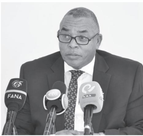
ሐገገ ገብረመስቀል ሚኒስትር