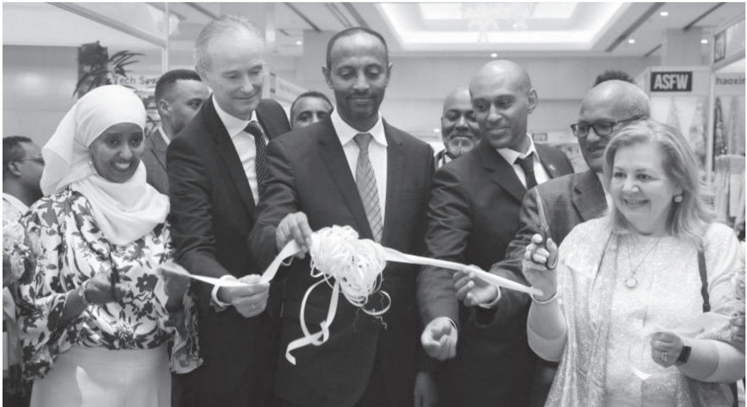
የንግድ ትርጉም በተካሄደበት ወቅት።

ጫማ፣ ቦርሳ፣ ቀበቶና ሌሎች የቆዳ ውጤቶች ሰፊ ገበያ ያላቸው በሀገር ውስጥ መሆኑን ጠቅሷል። በዓለም ገበያ ተወዳድሮ ለመግባት ቴክኖሎጂውን መጠቀምና የተለያዩ የምርት ማጠናቀቂያ ግብዓቶችን ማግኘት የገደቡ መሆኑን ጠቁማለች። ለዚህም እንዲህ ዓይነት ዓለም አቀፍ የንግድ ትርጉሞች እንደሚጠቅሙ ነው የገለጸችው። በንግድ ትርጉም ላይ የገበያ ትስስር ከመፍጠር ባለፈ ከአክሰሪ አስመጪ ከባንዶች ጋር የመተዋወቅና የልምድ ልውውጥ የማድረግ ዕድል እንዳለና ይህም ለሀገር ውስጥ