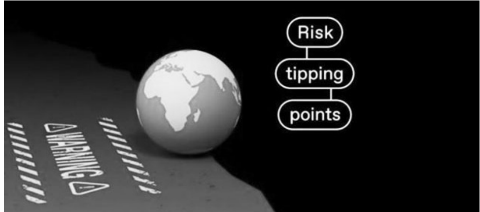
በ2040 ከባድ አደጋዎች በዓለም አቀፍ ደረጃ በአጥፍ ይጨምራሉ ተብሎ ይጠበቃል